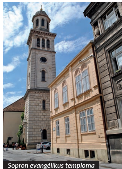
Sopron evangélikus temploma