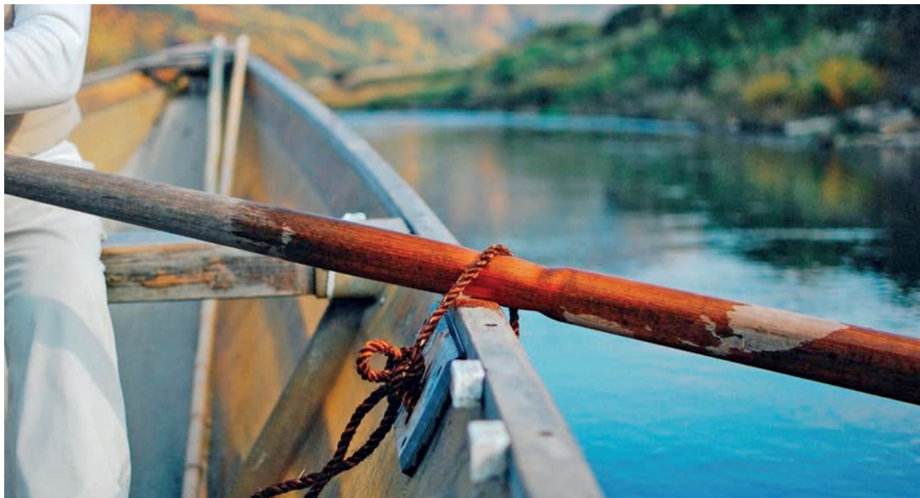
KÉPUNK ILLUSZTRÁCIÓ – FOTÓ: MATTHEW BUCHANAN / UNSPLASH.COM