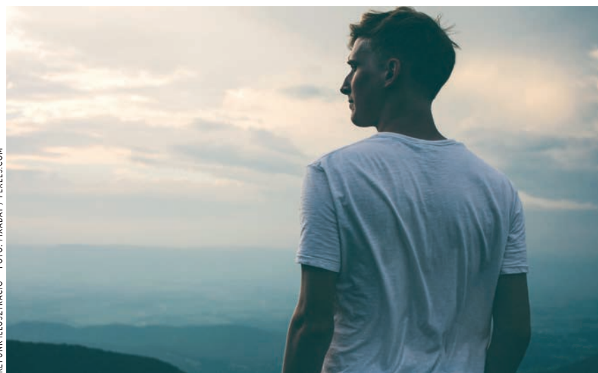
KÉPŐNK ILLUSZTRÁCIÓ – FOTÓ: PIXABAY / PEXELS.COM

Természetesen a három nap nem csak üldögéléssel és előadásokkal telt. A napok kezdetén és végén Joób Máté,