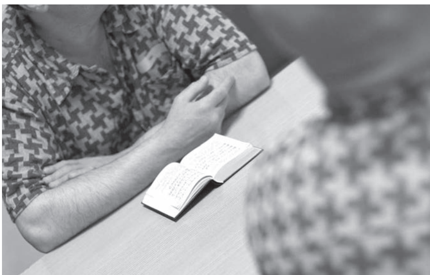
KÉPUNK ILLUSZTRÁCIÓ

Húszéves a Börtönlelkézi Szolgálat címmel online formában rendezték meg április 29-én azt az ünnepi konferenciát, amely címében hordozta az apropóját. A tanácskozáson három evangélikus lelkész munkáját is elismerték.