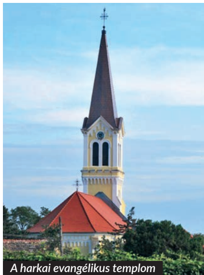
A harkai evangélikus templom