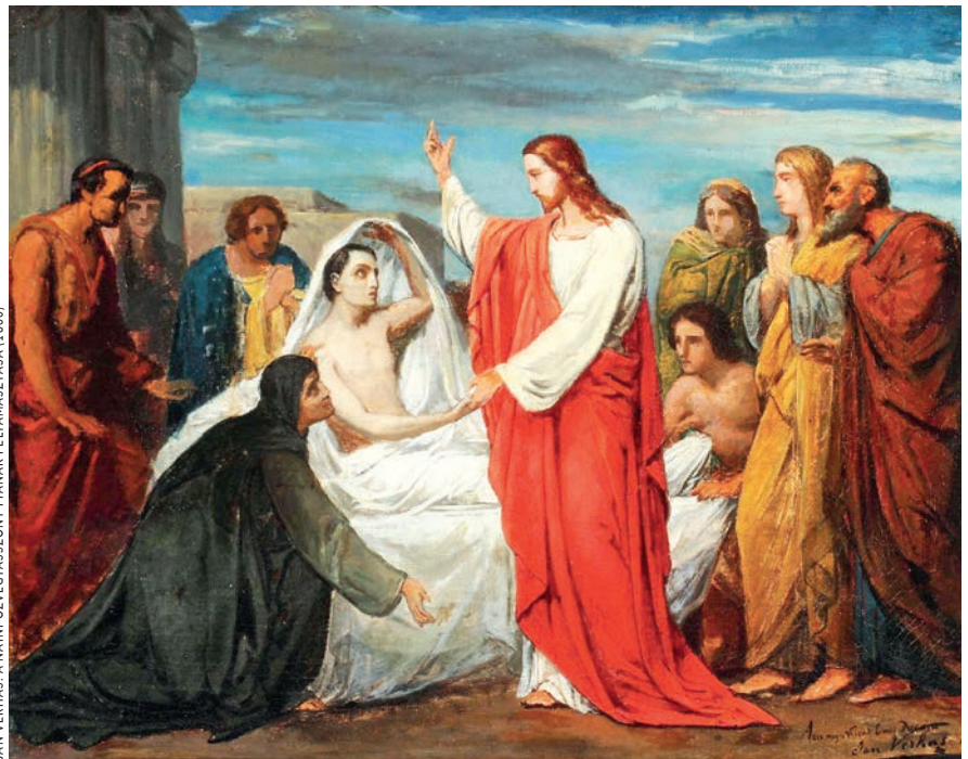
JAN VERHAS: A NAINI ÖZVEGYASSZONY FIÁNAK FELTÁMASZTÁSA (1860)

Sokféle kérdés fogalmazódhat meg bennünk a jelenünket megfigyelve. Ha ma is a hiten múlik a gyógyulás, akkor hogyan lehet, hogy annyi komoly hívő ember van körülöttünk, aki mégse gyógyul meg? Ha az imádságnak gyógyító ereje van, akkor miért nem találkozunk gyakrabban azzal, hogy emberek éppen a mi imádságunk hatására gyógyulnak meg? Vagy ezt ki se mondhatjuk? Vagy nem jól imádkozunk? Vagy nincs elég hitünk? Vagy rosszul értjük az Írásokat? Vagy rosszul értjük a csodát? Vagy nem is gondoljuk komolyan, amikor a zárókönyörgésekben konkrét emberek, konkrét gyógyulásáért imádkozunk, hogy tudniillik ők valóban meg fognak gyógyulni ettől?