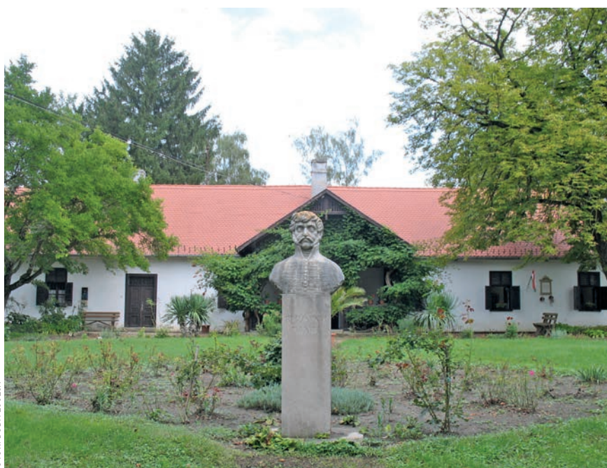
„Dani uraság” niklai kúriája