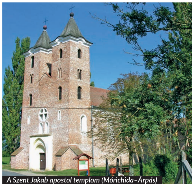
A Szent Jakab apostol templom (Mórichida-Árpás)