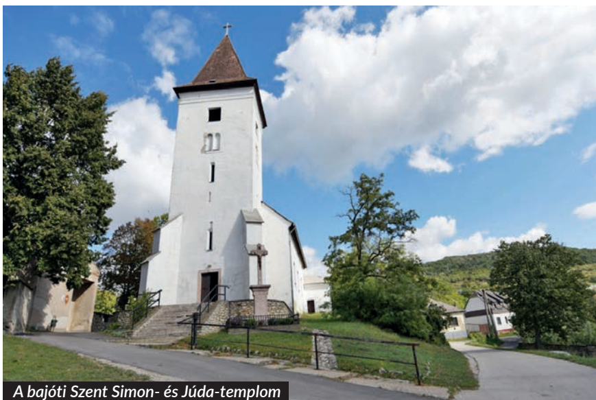
A bajóti Szent Simon- és Júda-templom

emlékhelyek, zsinagógák), kastélyok, hangulatos régi városrészek megtekintését ajánlják az érdeklődők figyelmébe. E megyében mintegy százötven település érintett az úthálózatban, a legkisebb falvaktól kezdve egészen a nagyvárosokig, köztük Győr, Sopron vagy Mosonmagyaróvár. A kerékpáros zarándokút része a fertődi Esterházy-kastély, a nagycenki Széchenyi-kastély és a világörökség részének nyilvánított Pannonhalmi Bencés Főapátság, valamint a Fertő-táj is.