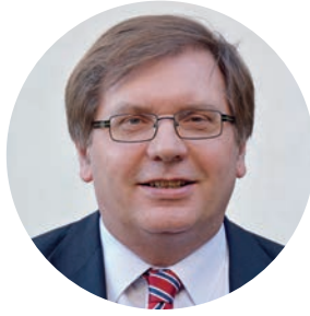
Fabiny Tamás püspök Északi Evangélikus Egyházkerület