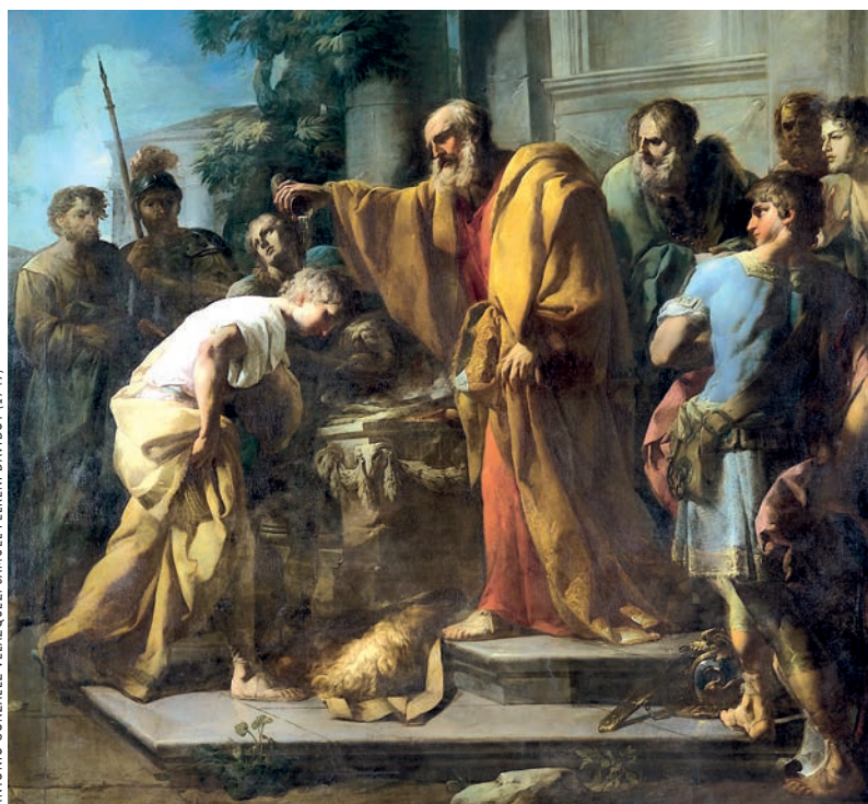
ANTONIO GONZÁLEZ VELÁZQUEZ: SÁMUEL FELKENI DÁVIDOT (1749)

Az Úr lelke szállt rá... Mármint Dávidra, a jópofa, de nem különleges kisserácra, hogy aztán Izrael leglegendásabb királya legyen. Nem azért, mert ő ilyen csodálatos volt – életútjának bőven voltak árnyékos szakaszai –, hanem mert olyan lelkület vezette, amelyet fentről kapott. Így tudott később jobban örülni