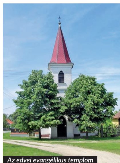
Az edvei evangélikus templom

A projekt már 2018-ban elkezdődött, ám jelentősége az utóbbi időben felértékelődni látszik, hiszen a SacraVelo olyan biztonságos kikapcsolódást nyújt belföldön, amelyre egyre nagyobb igény mutatkozik a külföldi utazások korlátozása miatt. Most, a fokozatos nyitások alkalmával is arra biztathatunk mindenkit, hogy bátran lehet kétkerekűre ülni és egy-egy túrát tenni.