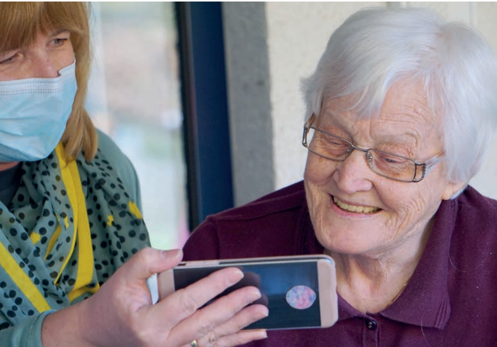
KÉPUNK ILLUSZTRÁCIÓ

„ Mindannyiunk öröme a személyes találkozás lehetősége, ugyanakkor közös felelősségünk az ellátottak védelme. ”