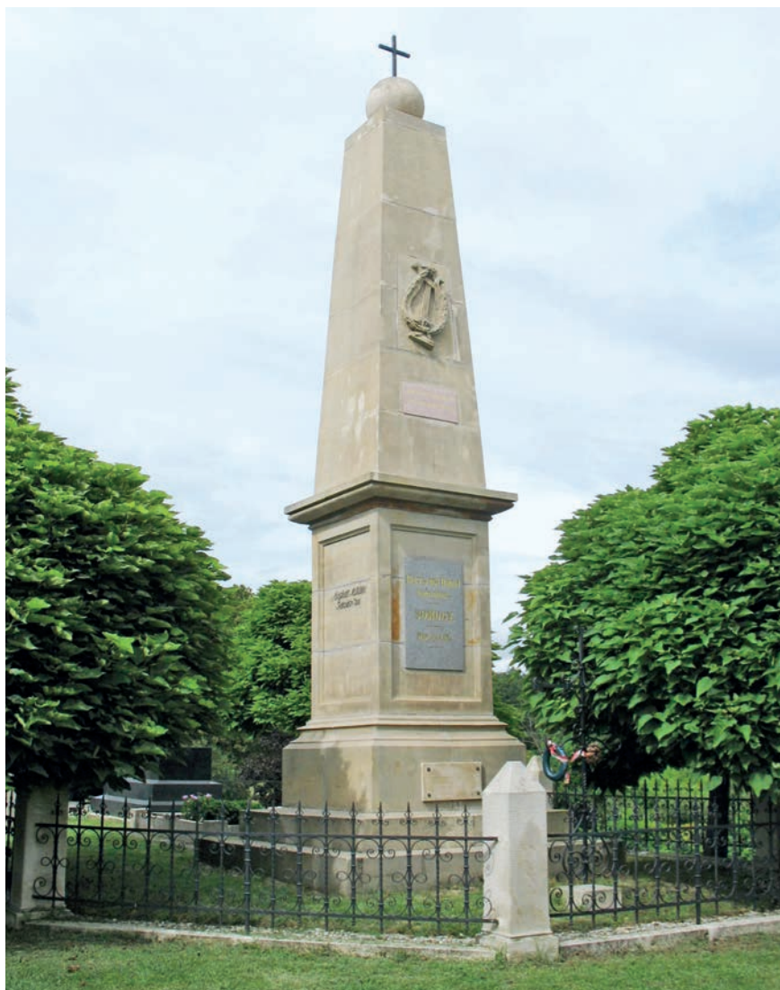
Berzsenyi Dániel síremléke Niklán