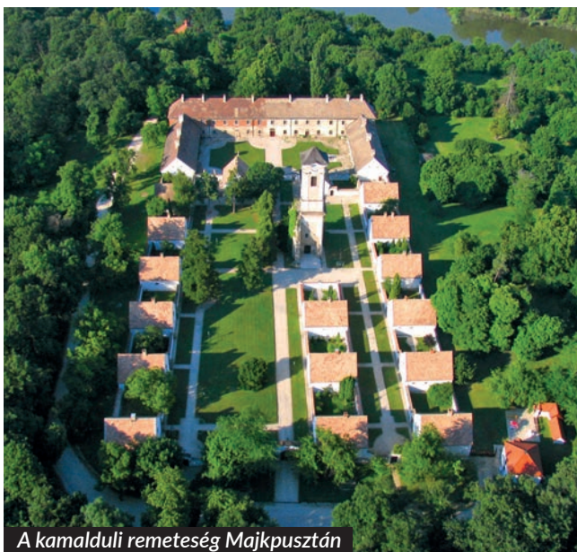
A kamalduli remeteség Majkpusztán