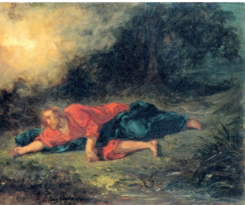
EUGÈNE DELACROIX: FÁJDALOM A KERTBEN (1861)

Imádkozzunk! „Szentséges teste érettünk adatott, / Halála életet hozott. / Ő ennél többet nem kínálhat nekünk, / Erről mostan emlékezzünk! / Irgalmazz, Úristen! / Urunk, a te nagy szereteted / Erre téged így kényszerített, / Kiontott, szent véred / Érettünk megfizetett. / Irgalmazz, Úristen!” (EÉ 304,2) Ámen.