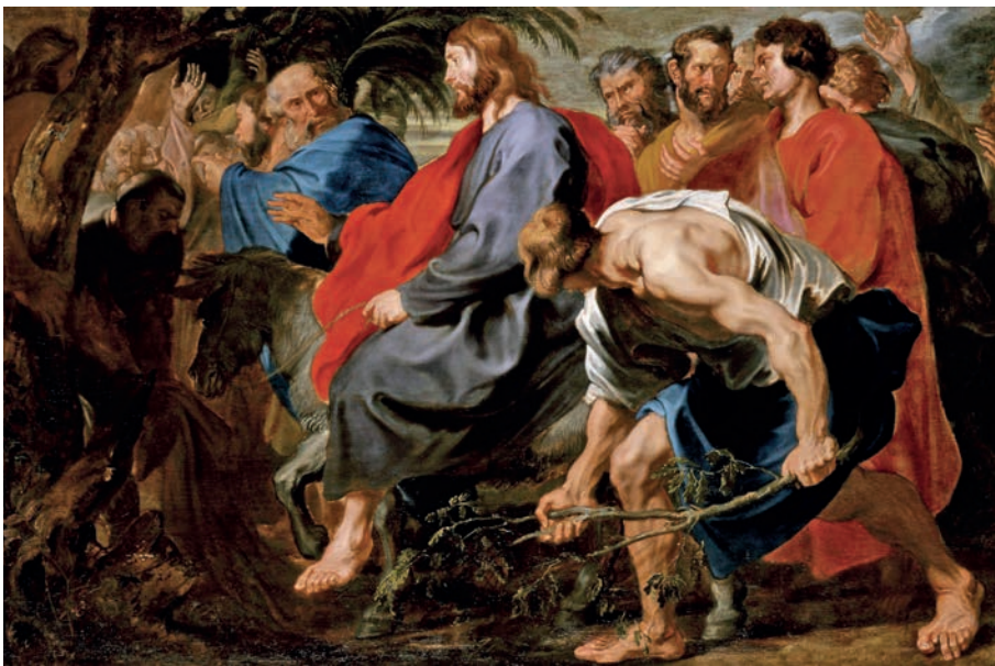
ANTHONY VAN DYCK: KRISZTUS BEVONULÁSA JERUZSÁLEMBE (1617)

sél. A kőszívű kivonulva városából, a hatalmaskodás őrült tobzódásában, amely irtóvádaszat képében jelenik meg, elvezítette a lelkét, önmagát, majd mindent. De az Igazsággal való találkozás ránehezedő ítéletként megtöri a dölyfös kőszívet, megsemmisítetik, és ekkor minden átfordul: