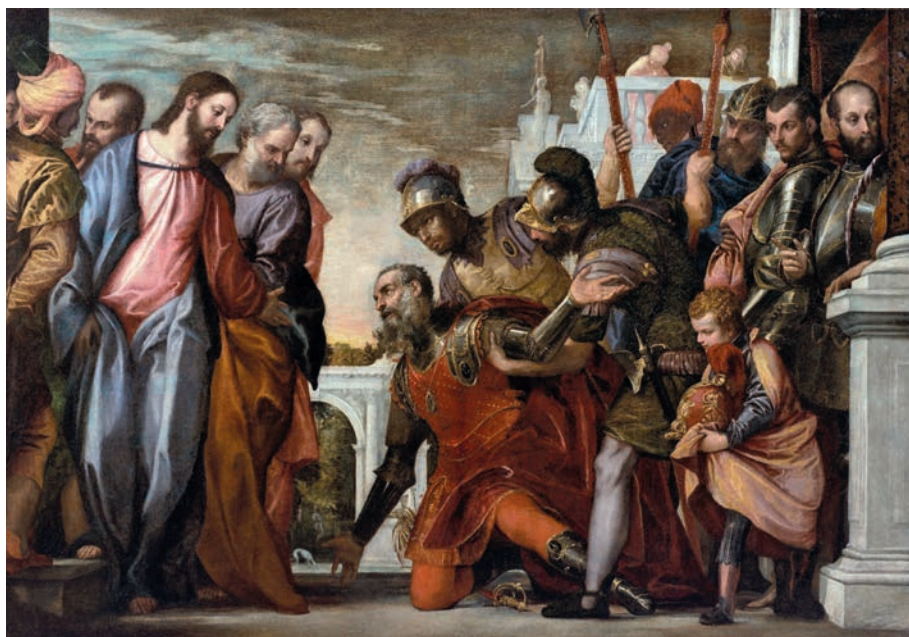
PAOLO VERONESE: JÉZUS MEGGYÓGYÍTJA A SZÁZADOS SZOLGÁJÁT (1585 KÖRÜL)

Ma sem tesz mást Jézus, mint ezt üzeni nekünk is: van remény! „... íme, én veletek vagyok minden napon a világ végezetéig ” – szólal meg, vigasztal meg (Mt 28,20). Nekünk szól Jézus. Akik ma különösen is félünk, szorongunk egy világvégéjé kellős közepén, a privát vagy éppen közösségi világvégéktől. Ő nyújtja a kezét, ő megérint. Ő szóba áll. Velünk is. Ma is. Mert ő élő Úr, nem pedig egy történelmi szereplő a sok közül. Ő gyógyító Úr, nem pedig egyházi bálvány. Ő mozgó, felénk mozduló Úr, nem pedig mozdulatlan, tehetetlen kép. Ő, aki a százados szolgáját is meggyógyítja, sőt bizonyos értelemben a századost is, amikor ezt mondja: „Bizony mondom nektek, senkiben sem találtam ilyen nagy hitet Izráelben. [...] Menj el, és legyen a te hited szerint. És meggyógyult a szolga még abban az órában.” (Mt 8,10.13)