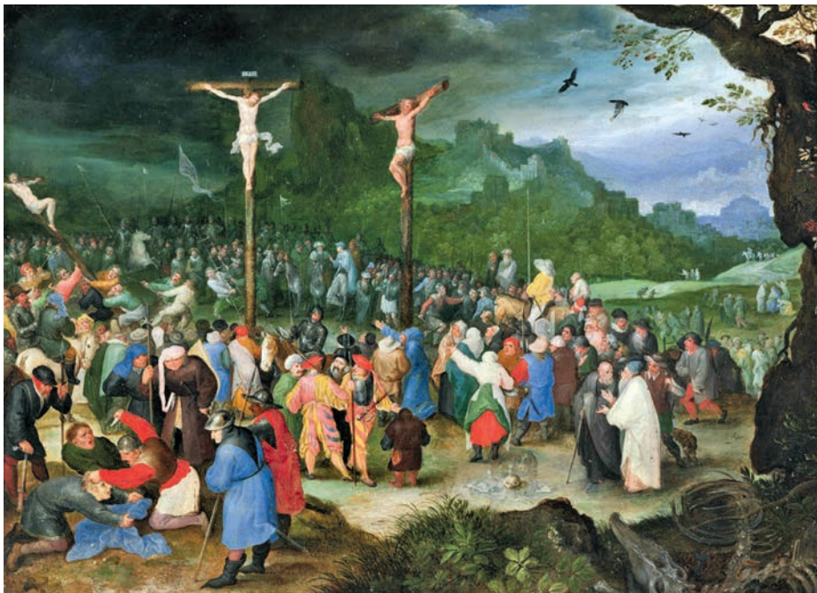
ID JAN BRUEGHEL: KERESZTFESZÍTÉS (1596 KÖRÜL)

De vajon nem minden csoport kiszolgáltatott-e ennek a zártágnak? „Vak dióként dióban zárva lenni / s törésre várni beh megundorodtam” – írja Babits Mihály A lírikus epilógiájában .