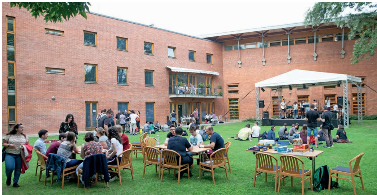
FOTÓK: MAGYARI MÁRTON / KÉPEINK ILLUSZTRÁCIÓK

vel, sallangmentességével inspiráló lehet számukra. Így a lényeg felől indulva megérkezhetnek a hagyományos gyülekezeti közösségbe is.