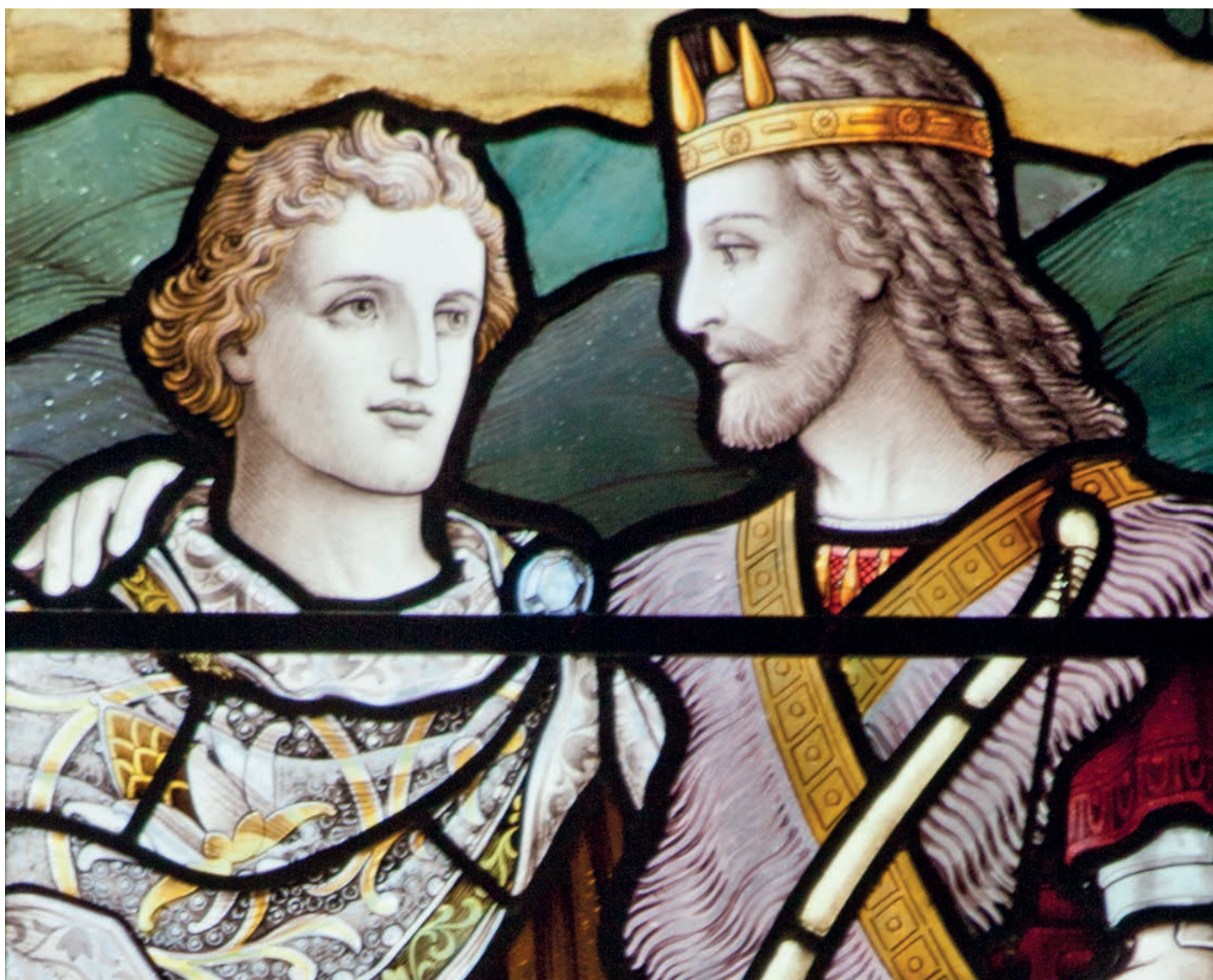
JONATÁN ÉS DÁVID AZ EDINBURGHI SZENT EGYED-KATEDRÁLIS Ó-LOMÓVEG ABLAKÁN