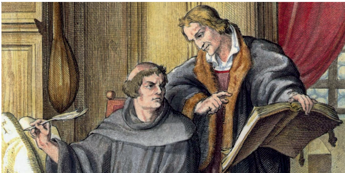
LUTHER ÉS MELANCHTHON GUSTAV KÖNIG METSZÉSEN (1847)