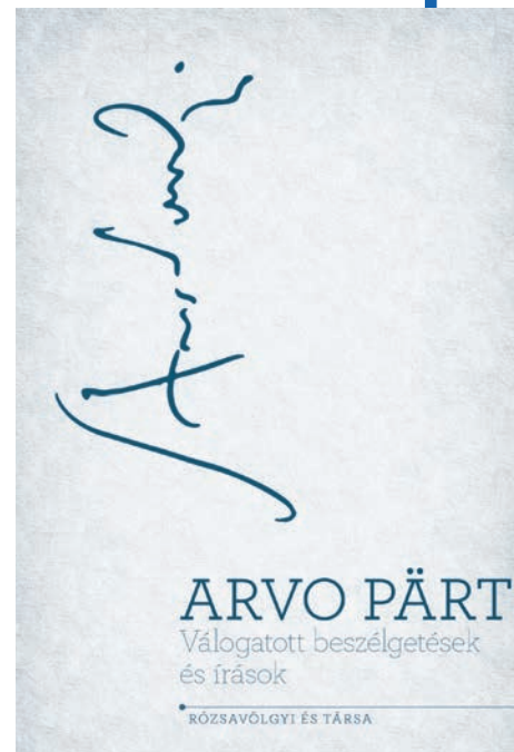
Arvo Pärt: Válogatott beszélgetések és írások. Rózsavölgyi és Társa Kiadó, Budapest, 2019. Ára 3490 forint.

Érdeemes kiemelni, hogy Arvo Pärt evangélikus családba született, a lutheri elveket vallotta, a zene azonban egy idő után a keleti ortodoxia felé terelte gondolkodását, jelenleg egy ortodox gyülekezet aktív tagja.