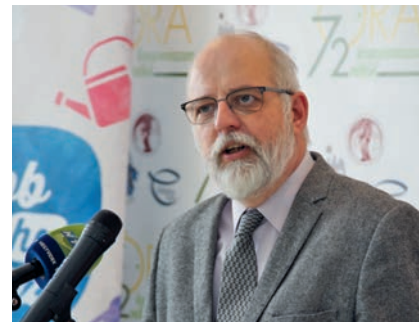
FOTÓ: 72 ÓRA.HU

A Magyar Máltai Szeretetszolgálat családokat és időseket segítő budapest-békásmegyeri intézményében rendezték meg október 11-én a három történelmi keresztény egyház által szervezett önkéntes ifjúsági akció sajtómegnyitóját. Idén már tizenkettedszer startolt a 72 óra kompromisszum nélkül , amely egyszerre szolgálja a fiatalok aktivizálását és az ökumenét.