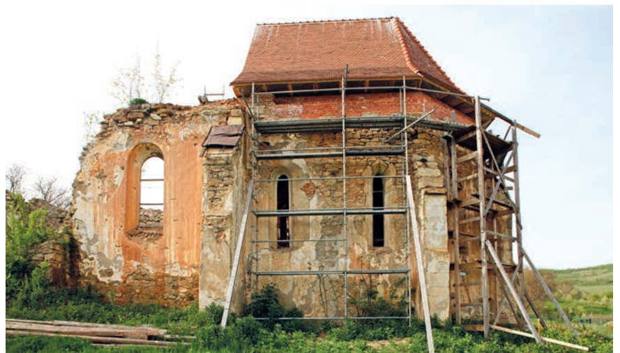
Ennyi áll még Kiszsolna 14. századi templomából

És hogy hol itt az Erdély határain jócskán túlnyúló szenzáció? A Navicella egykor a mai Szent Péter-bazilika elődjében volt látható, de az épület lebontásakor teljesen megsemmisült. Ám mivel a középkorban bevett dolog volt a másolás, ennek a műnek is akadnak másolatai szerte a világon, igaz, a kiszsolnai