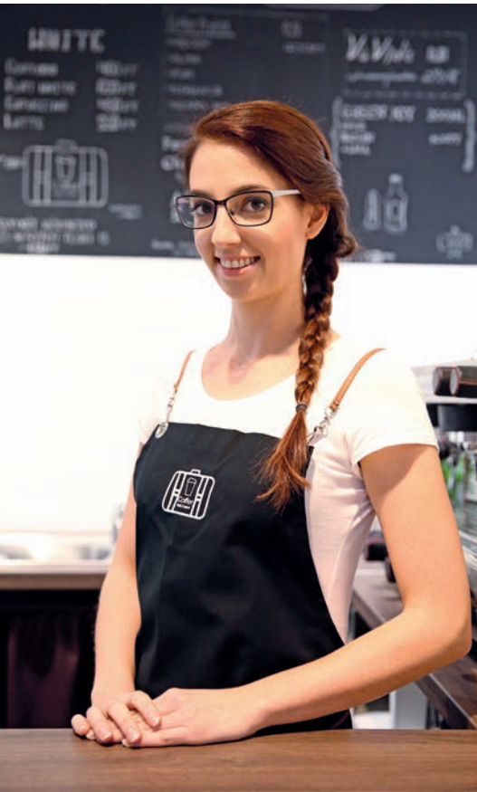
FOTÓK A COFFEE KÁVÉZÓ ARCHÍVUMÁRÓL

Tematikus városi sétával emlékeznek az embermentő lelkészre