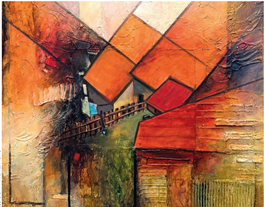
SZEVERÉNYI MIHÁLY FESTMÉNYE

Örömmel vállaltam a keresztelés szolgálatát. Mivel a falucskában csak katolikus kápolna van, ott tartottuk az alkalmat. Csendben vártam a családot a templom előtt sétálgatva. Szaladt felém az anyuka, boldogan újságolta, hogy a születés óta a fájdalom is elmúltak, nincs szüksége gyógyszerre, és a második baba