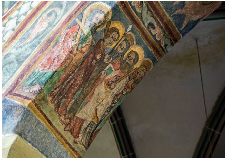
A medgyesi templom freskójának részlete a tanítványokkal

A gazdag festett díszítés mellett is kiemelkedő értékkel bír a monumentális szárnyas oltár. A késő gótikus alkotást aranyozott faragott-áttört elemek teszik még látványosabbá. Az oltár alépítményén, a predellán az utolsó vacsorát festette meg a mester. A nyitott oltár szekrényében egy 18. századi keresztrefeszítés-ábrázolás rejlik, a szárnyakon apostolok szimbólumai jelennek meg. Az oltár zárt állapotban nyolc táblán mutatja be a passiót, melynek különlegessége, hogy a korabeli néző számára ismerős helyszíneket, kis életképeket is rejt, mint ahogy a keresztre feszítés hátterében Bécs látképét fedezik fel sokan.