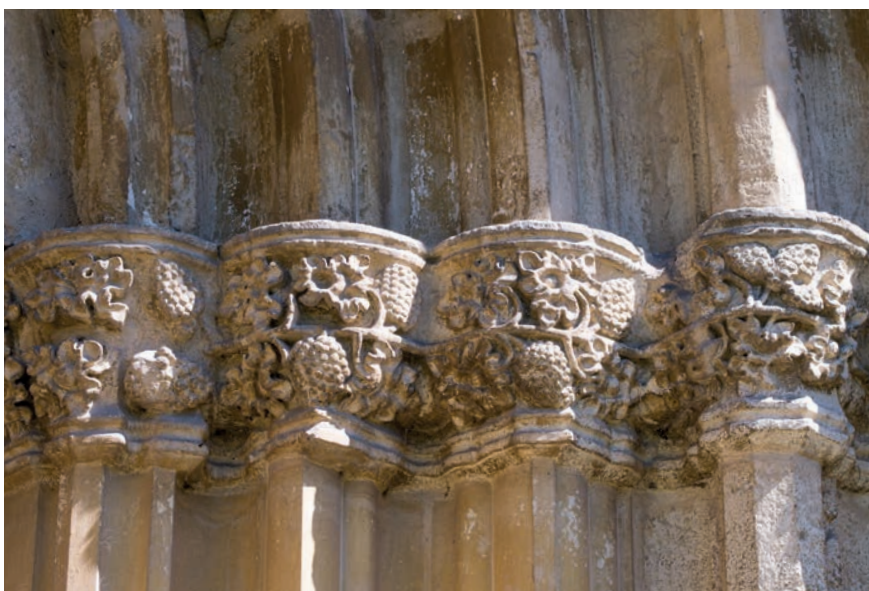
A szászbagácsi templom bélletes kapujának részlete

A németországi és hollandiai evangelikus templomokban több középkori emlékanyag – liturgikus felszerelés – maradt meg épen, mint más felekezeti templomokban. Ez korántsem véletlen – a felismerés mára el is terjedt a művészettörténeti kutatásban –, egyszerűen az az oka, hogy a régiségek megőrzése kifejezi a folytonosságot az apostoli egyház és az evangelikus egyház között. Ennek megfelelően – a lutheri tanításon alapulva – az evangelikusok mindig is megvédendő örökségként tekintett az elődeitől reá hagyott értékeire. Ilyen értékekkel, illetve megővő mikéntjével ismerkedhettek nemrégiben az erdélyi, Maros megyei Szászbagácson rendezett nyári egyetem hallgatói.