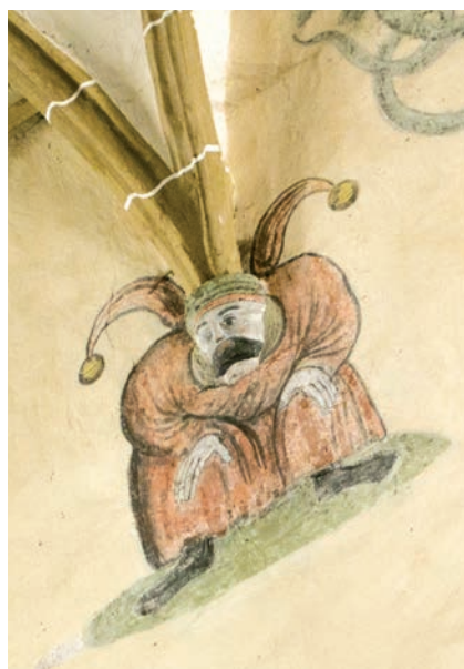
A berethalmi templom sekrestyéjének bejárata és a bolond festett alakja a diadalívén

A templom tele van kuriózumnak számító részletekkel. Még az intarziadíszes sekrestyeajtó bonyolult zárszerkezete is különlegességnek számít. Talán még egy részletre érdemes felhívni az olvasó figyelmét: a berethalmi erődtemplom diadalívén templomba nem illő alakokat fedezhetünk fel – bolondfigurák néznek le ránk a boltívek indításáról. Bolondok nemhogy a templomi, de a világi falfestészetünkben is szinte teljesen hiányoznak (kivételt jelent a budapesti Táncsics Mihály utca 24. szám alatti házból származó freskótöredék, amelyen táncoló párt kísér egy bohóc; ezt a falképet ma a Budapesti Történelmi Múzeumban őrzik).