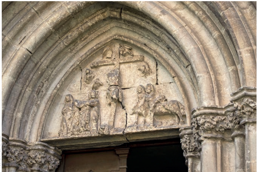
A riomfalvi templom kaputimpanonja

A szerző hasonló témájú írása a Credo evangélikus folyóirat 2019/1–2. számában olvasható Változás és maradandóság – Az elmúlás és újjászületés képe az erdélyi templomi be rendezéseken címmel.