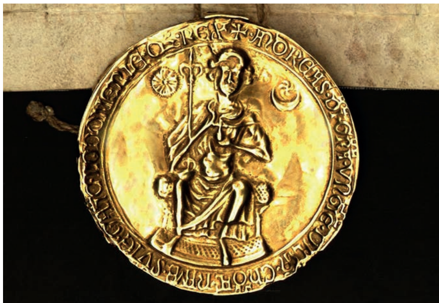
A II. András király által 1222-ben kiadott Aranybulla függőpecsétje

A harctéri katonalelkészi szolgálatból fokozatosan nőtt ki az igény az állandó jellegű hierarchia iránt. Ennek jelei akkor mutatkoztak, amikor a banderális hadviselést a zsoldoshad sereg váltotta fel. A Német-római Császárság zsoldoseregeinél zászlóaljanként volt egy pap, akinek felfogadásáról a parancsnok gondoskodott. Ők tulajdonképpen zsoldos katonalelkészek voltak. A zsoldos katonaságot váltotta fel az állandó hadsereg, amely békeidőben és