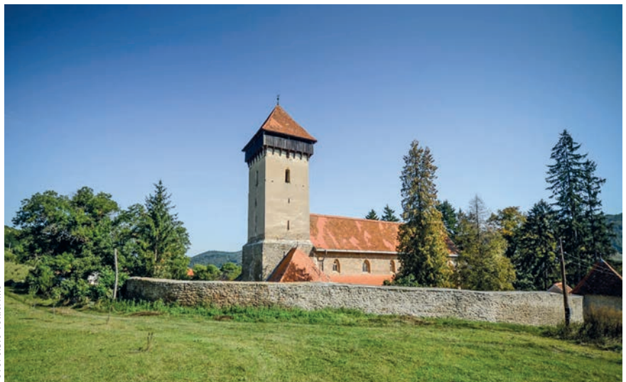
Az almakeréki erődtemplom