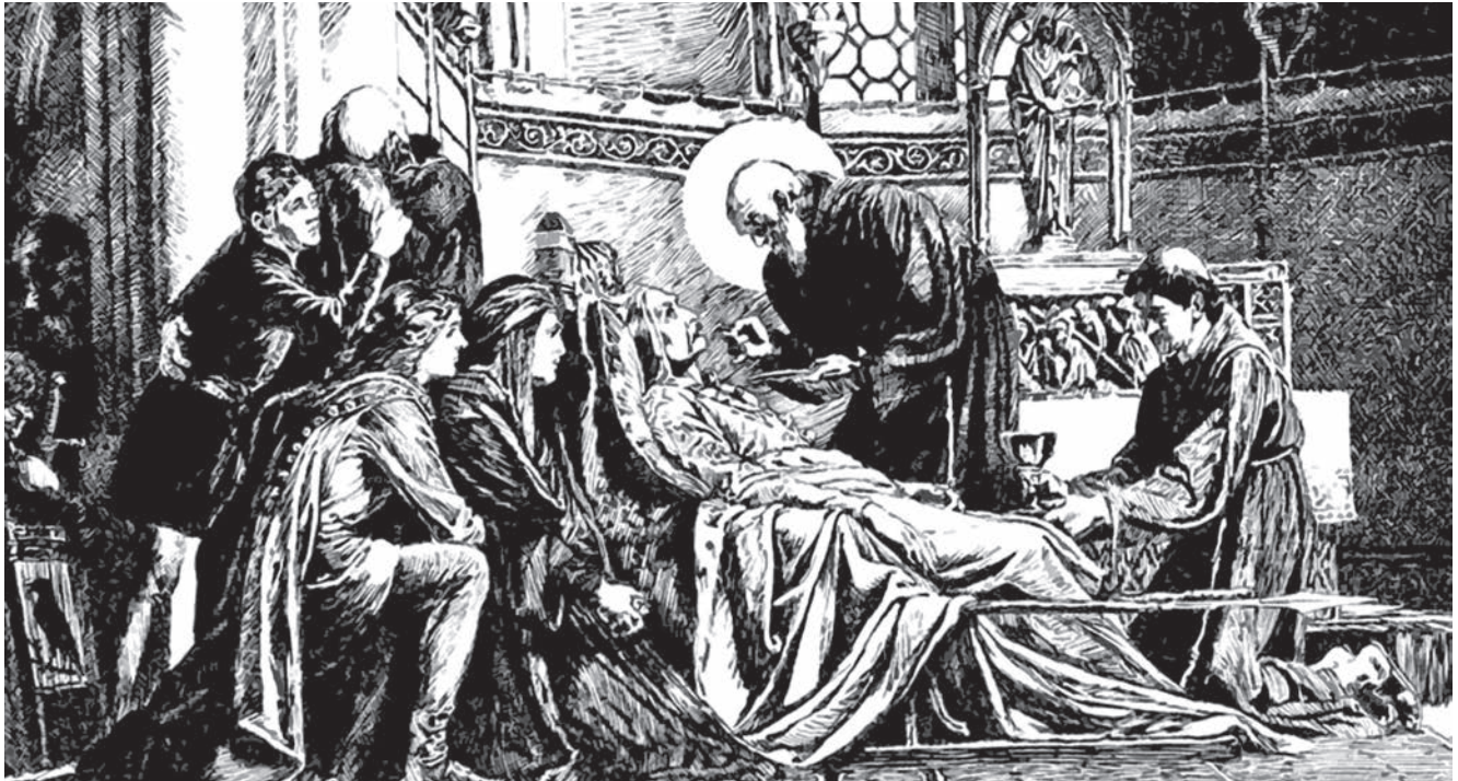
GRAFIKA: HÁRY GYULA TOLLRAZA ALAPJÁN