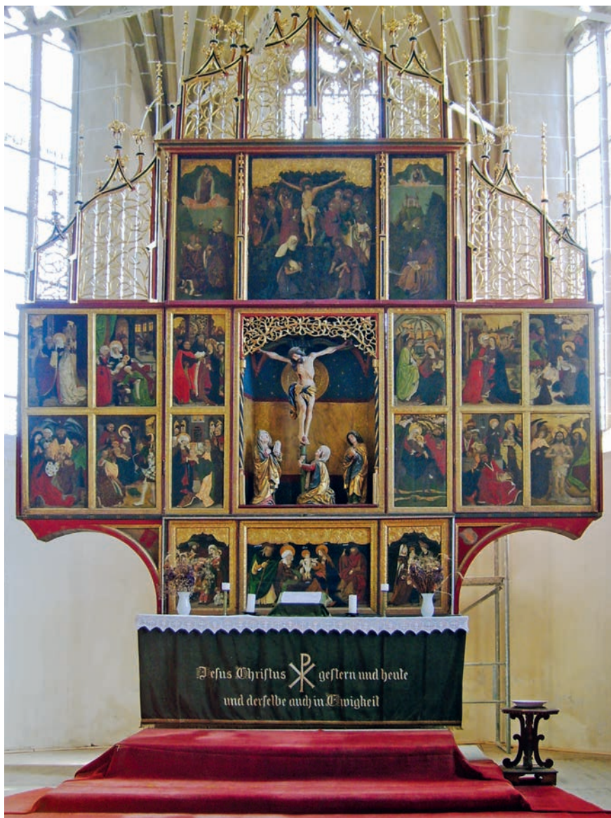
Szárnyas oltár a berethalmi templomban