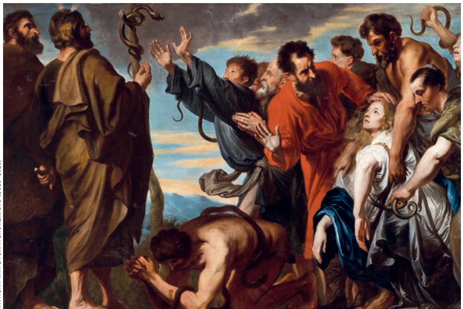
ANTHONY VAN DYCK: A BRONZKIVŐ (1618-1620)

Isten számára sohasem az a kérdés, hogy ki vagy, hanem hogy ki lehetsz. Az evangéliumokban azt látjuk, hogy Jézus mel-