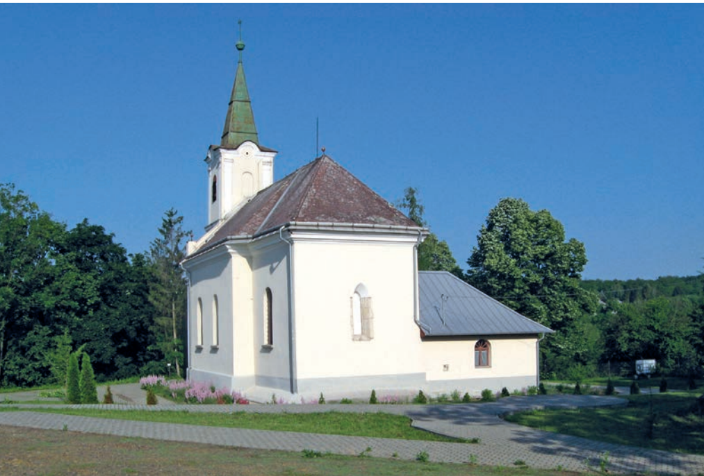
A fancsali evangélikus templom