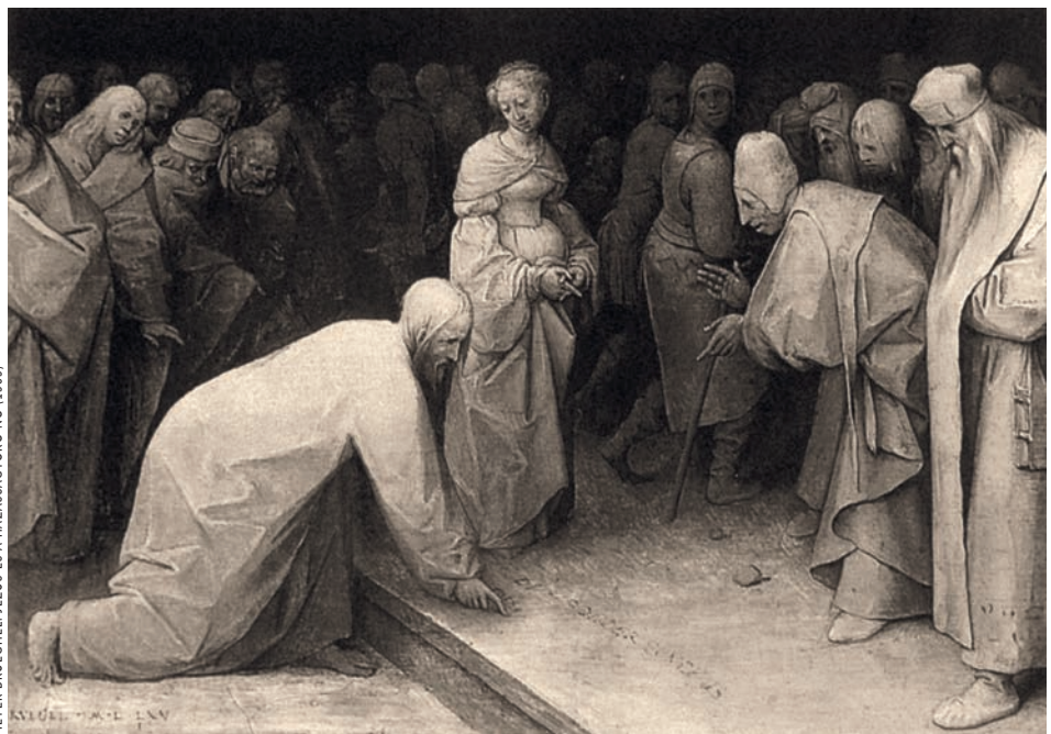
PIETER BRUEGHEL: JÉZUS ÉS A HÁZASSÁGTÖRŐ NŐ (1565)