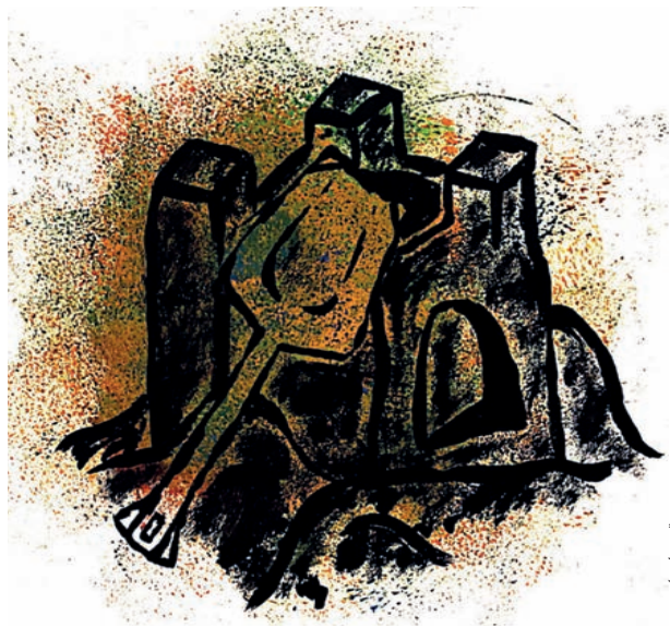
ILLUSZTRÁCIÓK: FÜLLER KAMILLA

• Fújj szappanbuborékot! • Ugróiskolázz! • Beszéljess egy idős emberrel az emlékeiről. Talán még azt is megtudhatod, ő mivel játszott kiskorában. • Focizz, kosarazz, röpj! Biciklizz, rollerezz, görkorizz! • Menj el állatkertbe vagy állatkereskedésbe, nézd meg az akváriumot, gyönyörködj a víz alatti világ szépségeiben! • Kóstolj meg egy új ételt! • Horgássz, túrázz, végezz kerti munkát apával vagy anyával. • Gyűjtsatok tábortüzet, és süssetek almát, virslit, krumplit! (Ezt természetesen csak felnőtt felügyelete mellett szabad!) • Tölts egy órát egy kisbabával vagy pici, totyogó gyerekekkel. Figyeld, gyönyörködj benne, segítsd! • Fess a barátaiddal tenyérszert! • Adj minden este hálát azért, ami veled történt! Kérj áldást a szeretteidre! Örülj, hogy velük élhetsz! Ha bosszúság ér, panaszold el Istennek! Reggel küldj egy mosolyt az Úrnak! • Ha segíthetsz, tedd meg! Ha segítségre van szükséged, kérd! • Énekelj, táncolj; mindegy, mennyire vagy benne tehetséges! • Legalább egy napot tölts vízparton! Ne feledd, Isten nem ment szabadságra. Ő gondol rád, és elkísér téged. ■