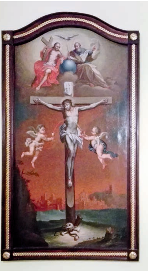
Barokk oltárkép a gyülekezeti teremben

jóval elmélyültebb könyvet vehet a kezébe.