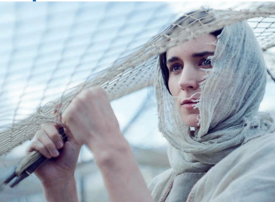
A MÁRIA MAGDOLNA CÍMŰ FILMBŐL

Amagdalai Mária, avagy Mária Magdolna. A Biblia különböző magyar fordításai több alakban említik a szóban forgó Máriát. „Elment a magdalai Mária, és hírül adta a tanítványoknak, hogy látta az Urat...” – olvassuk például János evangéliumában (20,18) a Magyar Bibliatársulat revideált új fordítása (2014) szerint. Más fordításokban a Mária Magdaléna vagy Mária Magdolna nevet találjuk. A Magdaléna jelentése ugyanis nem más, mint „Magdala városából való nő”. A Magdolna pedig a Magdaléna magyar alakváltozata.