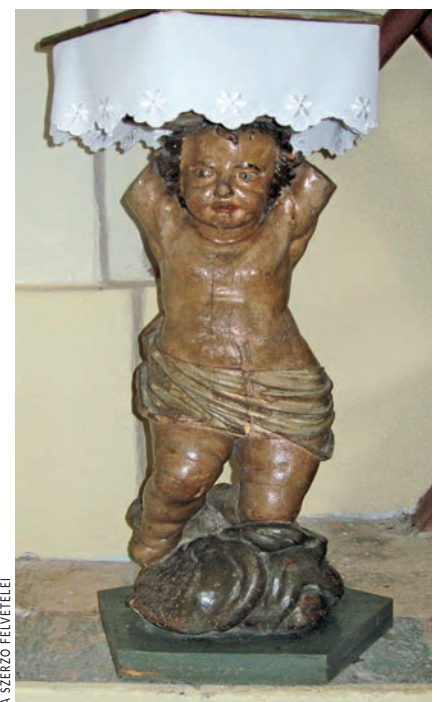
Ma is használatos barokk keresztlőkút