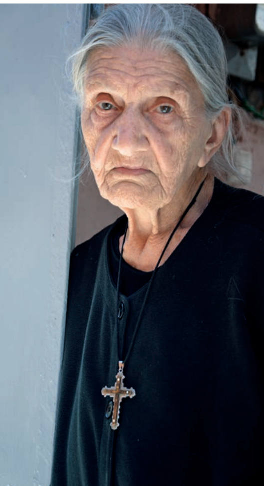
A SZERZŐ FELVÉTELEI