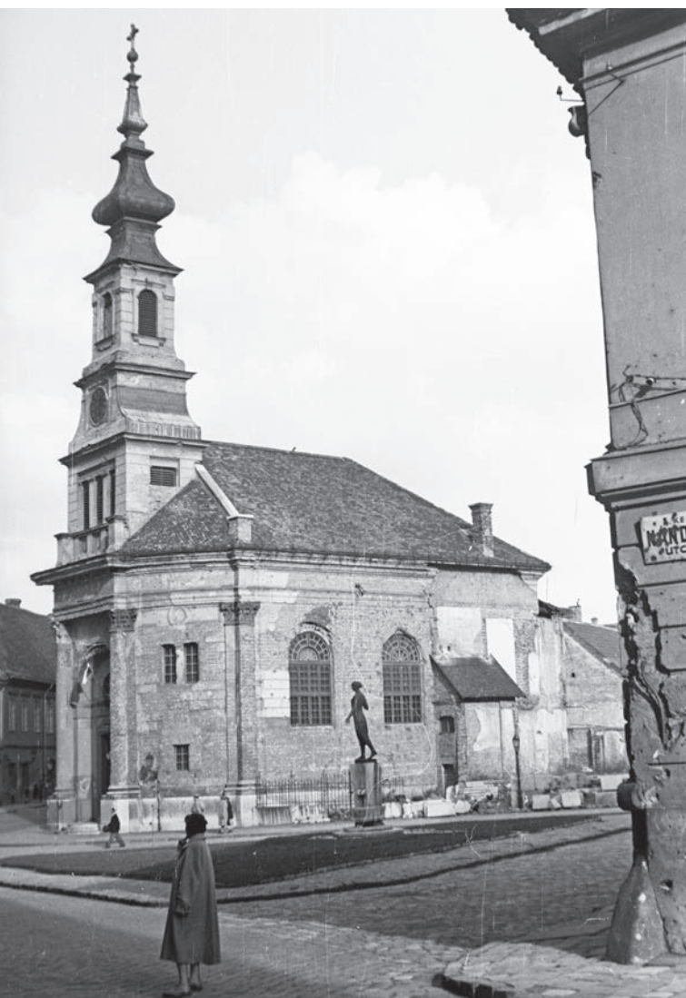
A BUDAVÁRI EVANGÉLIKUS TEMPLOM

olyan volt, mint egy külföldi stipendium. Sokat tanultam, de mást, mint amit könyvtárakban tanulhattam volna.