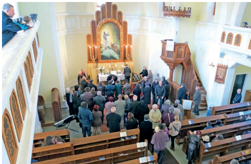
Úrvacsoraosztás a kaposvári evangélikus templomban