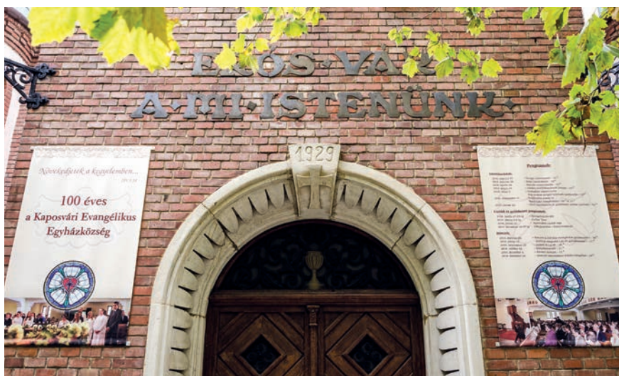
A kaposvári evangélikus templom homlokzata

Egyházunkban a kegyességi irányzatok mellett meghatározó a földrajzi elhelyezkedés, egy-egy gyülekezet történelme is. A különböző testvéri közösségekben különféle presbitériumok szolgálnak. Lelkészeket kérünk arra, összeállításunkban mutassák be, náluk hogyan működik, miben különleges a presbitérium. Azt reméljük, a helyi példákból sokan tudnak majd inspirálódni, ötleteket gyűjteni, imáikban az épülő gyülekezetekre gondolni.