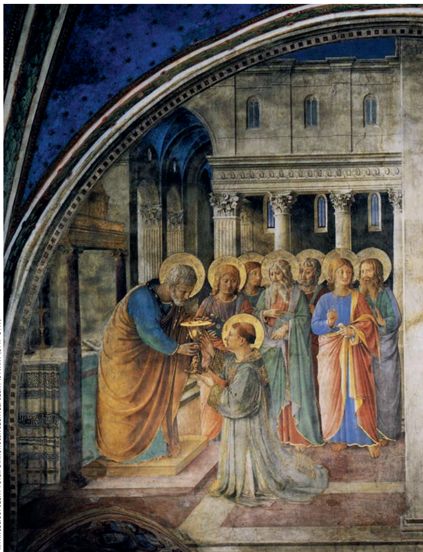
FRA ANGELICO: SZENT PÉTER DIAKÓNUSSÁ SZENTELI SZENT ISTVÁNT (1447–1449)

Pál a keresztény közösséget úgy aposztrofálja, mint „ egy test Krisztusban ” (Róm 12,5), ami a közös, Krisztus iránti elköteleződésen alapul. A keresztény közösség legfontosabb jellemzője tehát az egymástól való függés Krisztusban. Ez pedig az egymás iránti kölcsönös felelősségben fejeződik ki, amelyben pedig maga Krisztus kharisza , azaz kegyelme nyilvánul meg. Pálnál a „Krisztus teste” mindig mintegy ilyen értelemben véve „karizmatikus” közösségként jelenik meg, például: Róm 12,4–8; 1Kor 12,4–27; Ef 4,7–16. ▶