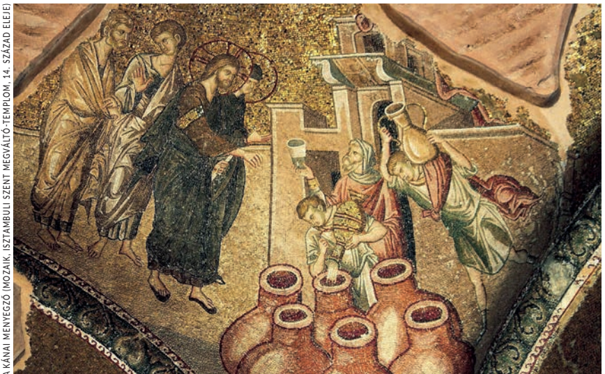
A KÁVALI MENVEZŐ (MOZAIK, ISZTAMBULI SZENT MEGVÁLTÓ-TEMPLOM, 14. SZÁZAD ELEJE)

Gyásznép vagy násznép. A fő kérdés számunkra is az, hogyan éljük meg a húsvét örömét. Istenre gondolva, hozzá imádkozva bűneink felett siránkozunk, vagy megértjük és átéljük a megváltás örömét, azt, hogy elvette bűneinket Fiában, Krisztusban? Mi