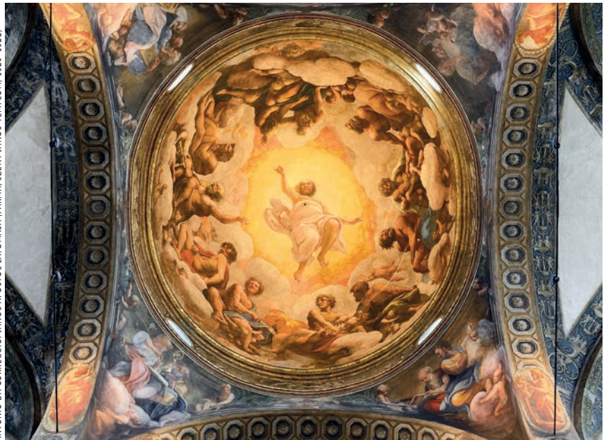
ANTONIO DA CORREGGIO: JÁNOS APOSTOL LÁTOMÁSA (PÁRMA, SZENT JÁNOS-TEMPLOM, 1520-1522)

A nagyszerű üzenet lényege az, hogy a Jeruzsálemben aláztos királyként bevonuló Jézus és a feltámadott, megdicsőült Krisztus, az univerzum Ura valójában ugyanaz a személy. Nemcsak a hozsánna hangozhat fel tehát ezen az ünnepen a benne reménykedők ajkán, hanem a doxológia is. Hiszen ő a „hű tanú”, aki a kereszthalál kitarított az Isten igazsága, irgalma, embermentő szeretete mellett.