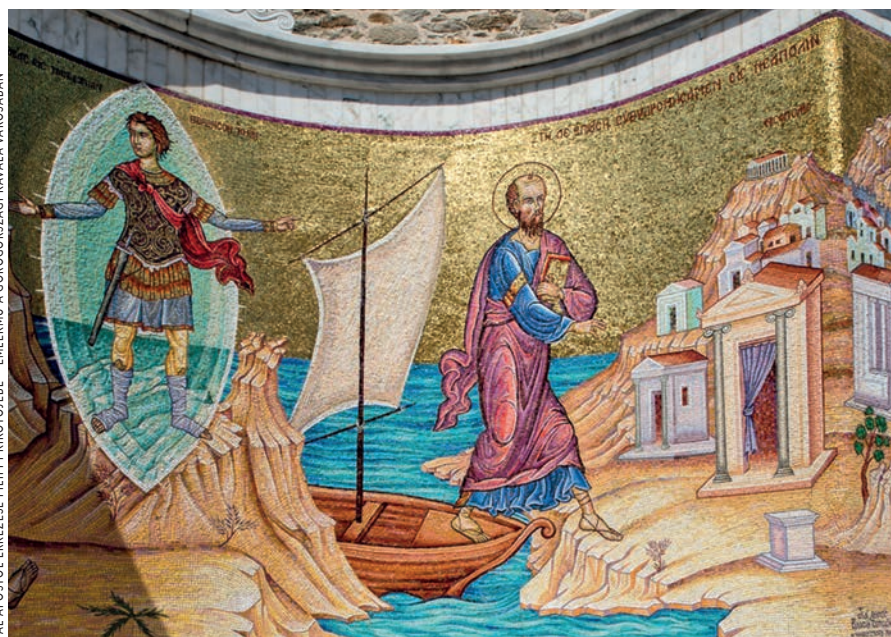
PÁL APOSTOL ÉRKEZÉSE FILIPPI KIVÖTŐÉRE – EMLÉKVÉ A GÖRÖGORSZÁGI KAVÁLA VÁROSÁBAN

ugyanis, hogy a világ szerkezete azóta megváltozott, a kérdésekben demokratikus döntést kell hoznunk. Eközben tiszteletben kell tartanunk a lelkiismereti és vallásszabadságot, más vallások követőire és a másként gondolkodókra is tekintettel kell lennünk, nem erőltethetjük rájuk a tőlük idegen kultúrát és hitet. Minden-