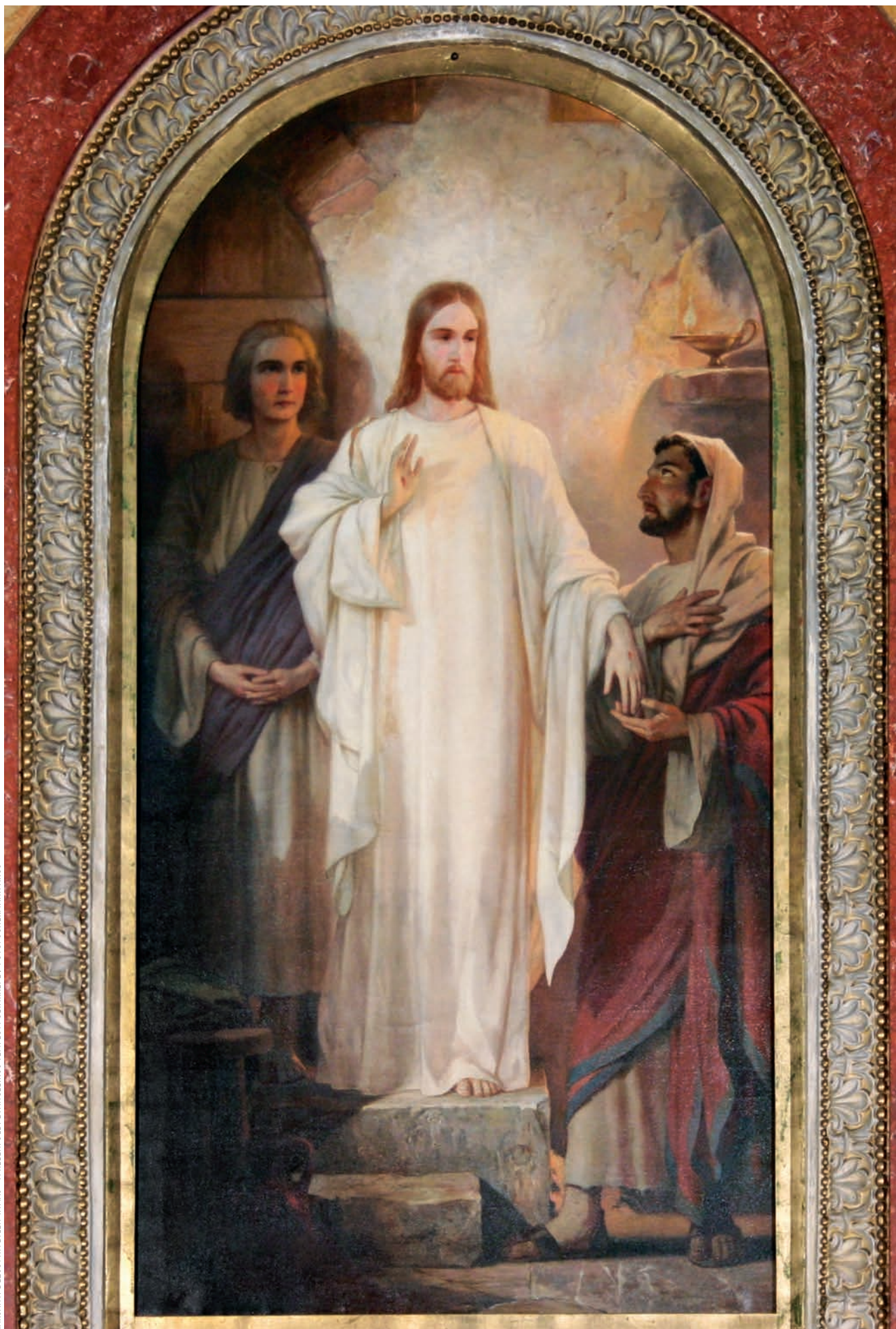
RAKSÁNYI DEZSŐ: HITETLEN TAMÁS - A KELENFÖLDI EVANGÉLIKUS TEMPLOM OLTÁRKÉPE