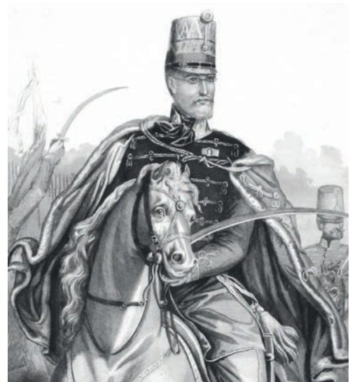
GÖRGEY ARTÚR BUDA VISSZAFoglalásának idején

Görgey Artúrt a szabadságharc leverése után Klagenfurtba internálták. Az emigrált '48-asok folyamatosan szították a gyűlöletet Görgey ellen. A gyűlöletkeltés élén szinte mindvégig Kossuth Lajos állt, aki – egyebek mellett – azt is terjesztette, hogy a Komáromnál súlyos fejsébet kapott Görgey fájdalmi elől a pálinkához