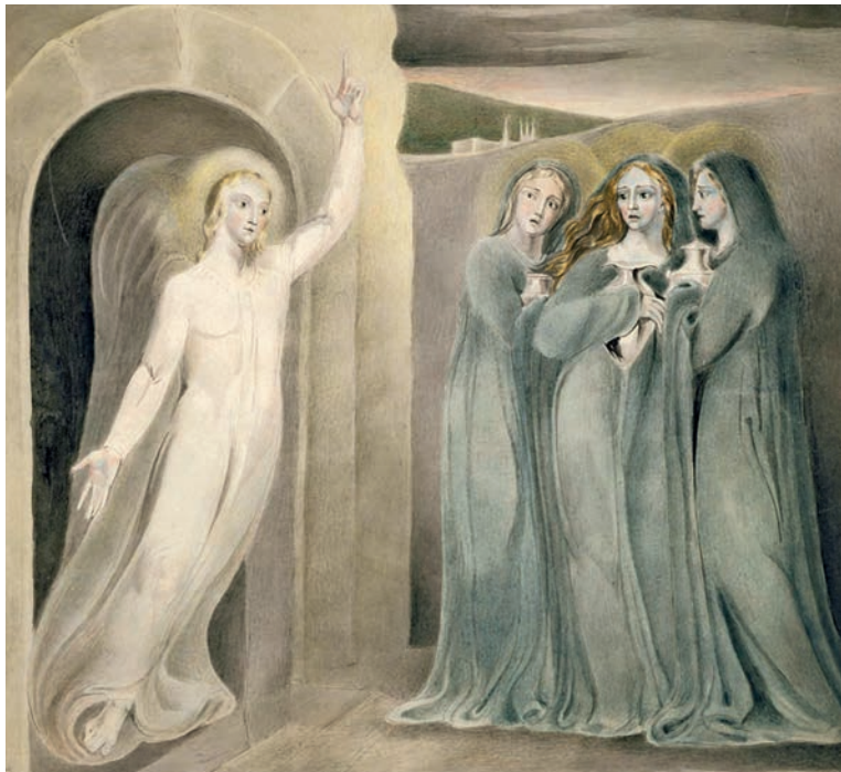
WILLIAM BLAKE: A HÁROM MÁRIA A SÍRNÁL (1800-1803)

A keresztfa tövében. A magdalai Mária és a másik Mária látták Jézust meghalni a kereszten. Távolról figyeltek sok más asszonnal együtt, akik korábban látták Jézust csodákat tenni, hallották tanítani, tapasztalták megkülönböztetés nélküli szeretetét, elfogadó közelségét. Bizonyára sírtak fájdalomban. Onnan távolabbról is jól hallhatták Jézus hangos kiáltását, láthatták a meggyötört test szenvedését. Tanúi voltak annak, ahogy ott, a Golgotán és talán a lelkükben is minden „elvégeztetett”.