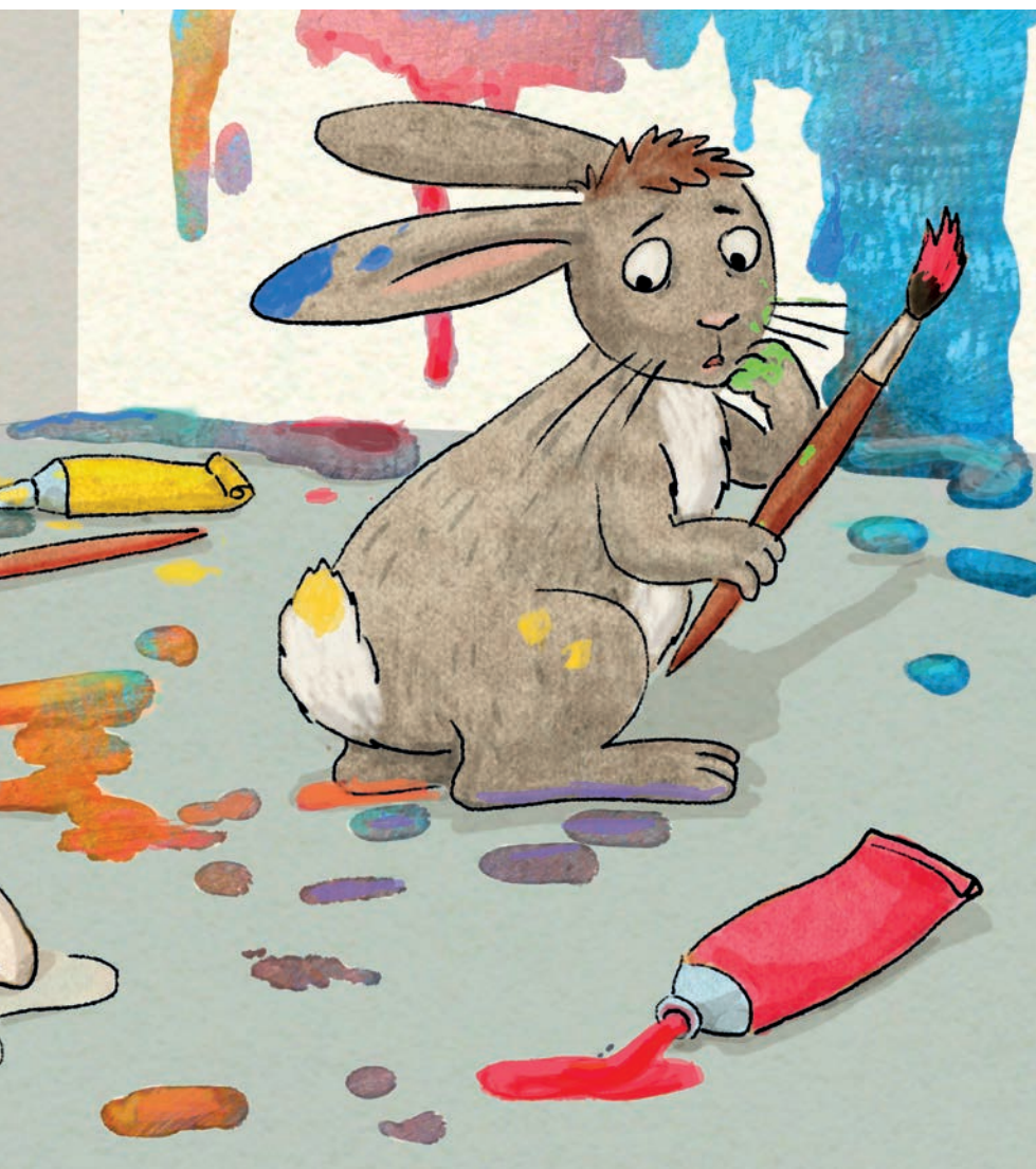
RAJZ: BÓDI KATALIN