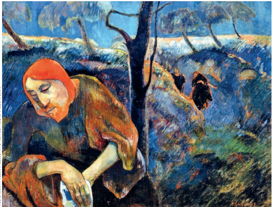
PAUL GAUGUIN: JÉZUS A GECEMÁNÉ-KERTBEN (OLAJ, VÁSZON, 1889)

Természetesen Krisztus halála a Golgotán, mint az üdvösség forrása, egyszeri és megismételhetetlen. Azonban éppen ez a történelmileg és üdvtörténetileg páratlan esemény válik a tengelyes tükrözés tengelyévé: „Ha valaki én utánam akar jönni, tagadja meg magát, vegye fel a keresztyét, és kövessen engem.” (Mt 16,24) Mi azért vehetjük fel, azért van egyáltalán értelme felvenni a keresztyént, mert Krisztus felvette az övét – értünk. „Ha ugyanis egygét lettünk vele halálának hasonlóságában, még inkább egygét leszünk vele a feltámadásának hasonlóságában is.” (Róm 6,5)