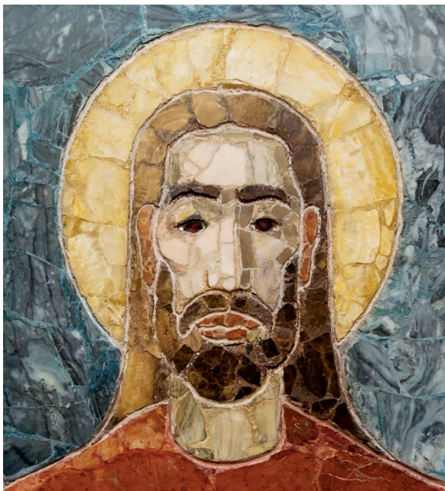
SZITA ISTVÁN ALKOTÁSA (RÉSZELET)

alakzatok úgy nyúlnak, zsugorodnak, mozognak, olyannyira humanizáltak, hogy nemcsak emberi alakokat, gesztusokat, de érzelmeket, konfliktusokat, élményeket, izgalmakat, tragédiákat és a megvilágosodás pillanatait is hozzájuk képzelhetjük” – mondta a budapesti Négy Évszak Klubban 1986-ban megrendezett kiállítás megnyitóján Haulisch Lenke művészettörténész, a 19–20. századi magyar festészet kiváló ismerője, aki évtizedekig kísérhette figyelemmel az autodidakta festő életét, és számos alkalommal segí-