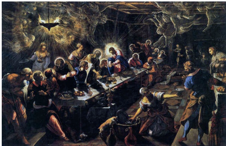
JACOPO TINTORETTO: UTOLSÓ VACSORA (OLAJ, VÁSZN, 1592-1594)

kedness, mintha szolgálatoddal és érdemeddel te hajlítanád Őt magadhoz. Nem, édes atyámfia, érdem és méltóság itt semmivé válik, s nem marad más, csak merő érdemtelen méltatlanság az egyik oldalon – nálad, s csupa irgalmas kegyelem a másik oldalon – Nála. Koldus és király találkozója ez” – írja Luther.