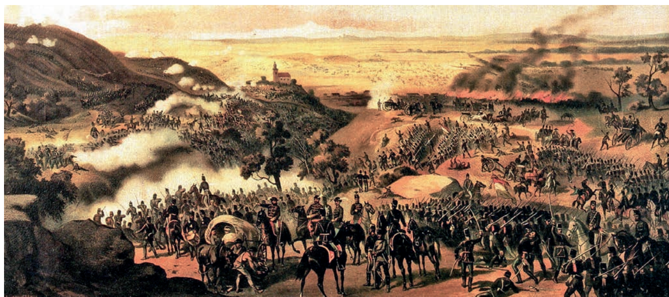
AZ ISASZEGI CSATA