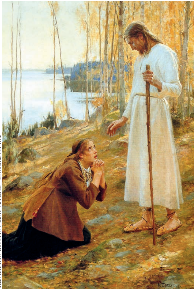
ALBERT EDELFELT: A FELTÁMADOTT KRISZTUS TALÁLKOZÁSA MÁRIA MAGOLINÁVAL (1897)

Logosz helyett logosz. János evangélista úgy írja le művének elején Jézus megjelenését, mint a testté lett Igét (görögül logosz ). Máté evangélista úgy írja le a korrump katonának és a hatalmát féltő elit paktumát, amellyel megpróbálják elhazudni a világtörténelem legnagyobb eseményét, mint „szóbeszéd”-et (görögül ez is logosz ). Mégis azt kell mondanunk, hogy az iménti címben az első logosz a „szóbeszéd”, és második az „Ige”. Mert