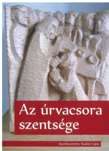
Az úrvacsora szentsége – Meditációk és imádságok az úrvacsoráról. Szerkesztette Szabó Lajos. Luther Kiadó, Budapest, 2017. Ára 1750 forint.