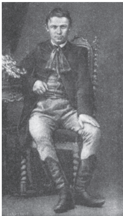
Mikszáth Kálmán diákkorában

Visszatérve Mikszáthra, a nebulóra: ötödikes korában már verseket írt, és többször elnyerte az önképzőkör díját. Beleszeretett az olvasásba. Legkedvesebb könyveim címmel írta később: „Az első