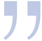
Fabiny Tamás püspök Északi Evangélikus Egyházkerület

E gyházunk reformációi emlékbizottságának elnökeként eseményekben – és reménység szerint áldásokban – gazdag esztendő végén készíthetnek amolyan év végi leltárt, némileg vissza is tekintve az elmúlt nyolc évre, amelyben elkötelezett munkatársakkal tehetjük a dolgunkat. Nekik ezúton is köszönetet mondok. Ezen a helyen elsősorban az egyházi bizottság által szervezett munkát összegzem.