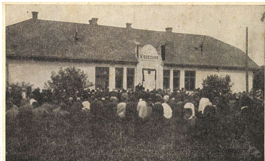
Üdvözlet Magyarbólyból. Kisdedóvó, a hősök emlékére.