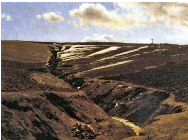
SZINYEL MERSE PÁL: HŐVIVADÁS (1884-1895)

Korai szántás. „Le kell takarítani a kertet” – szolt nagymamám minden egyes évben, amikor a terménybetakarítás végéhez érve készültünk az őszi szántásra. Minden gondos földműves ősszel szántja a földet, nem pedig tavasszal. Nem újság ez. Évek, évtizedek óta hangoztatták, mégis akadnak ma is, akik nem fogadják meg ezt a jó tanácsot. Még úgy van sok helyütt a tarló, ahogy learatták. Kigazosodott, gyúrja, tiporja a legelő jószág. Olyan kemény már a fekete, búzatermő föld tarlója, mint a szérűskertben régen a nyomtatóhely volt. Égette, szárította a forró nyári napsugár, folytatja ezt a munkát az őszi szél. Az ilyen kemény föld nem veszi be a téli nedvességet: az eső, hólé lefut róla.