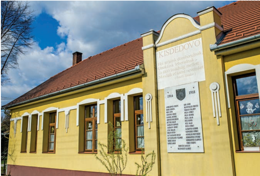
A kisdedóvó épülete napjainkban