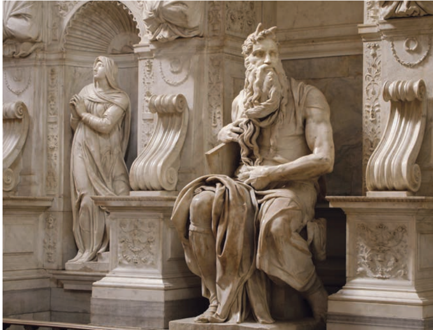
MICHELANGELO MÓZES-SZOBRA A RÓMAI SAN PIETRO IN VINCOLI-BAZILIKÁBAN

Ahogy Izráel népe az Egyiptomból való szabadulásban tapasztalta Isten szeretetét, úgy mi Jézus Krisztusban találkoztunk