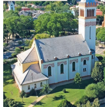
Krisztusért járva követségben. Széll Bulcsú evangélikus lelkész igehirdetése. Kispesti Evangélikus Egyházközség, Budapest, 2017. Ára 2000 forint.

Széll Bulcsú evangélikus lelkész igehirdetése