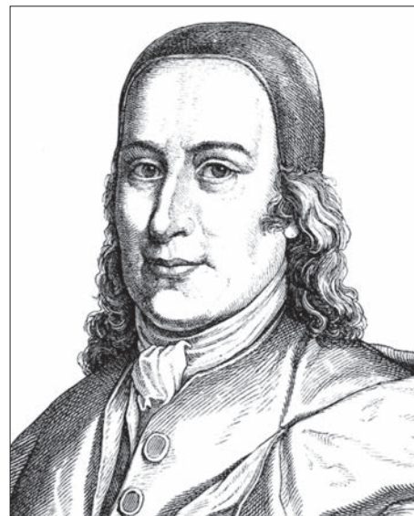
Nikolaus Ludwig Zinzendorf gróf

A hatalmas szervezőmunkával párhuzamosan Zinzendorf folyamatosan képezte magát, elvégezte a teológiát (evangélikus lelkésszé, később pedig püspök-ké is szentelték). De mindeközben 1727.