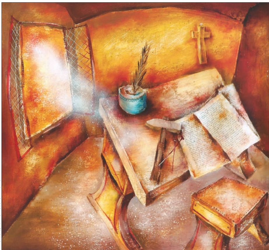
WITTENBERG, 1517. OKTÓBER 31. HAJNALA