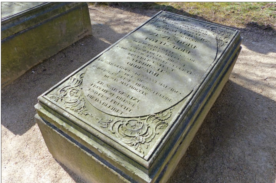
Zinzendorf gróf síremléke a herrnhuti temetőben