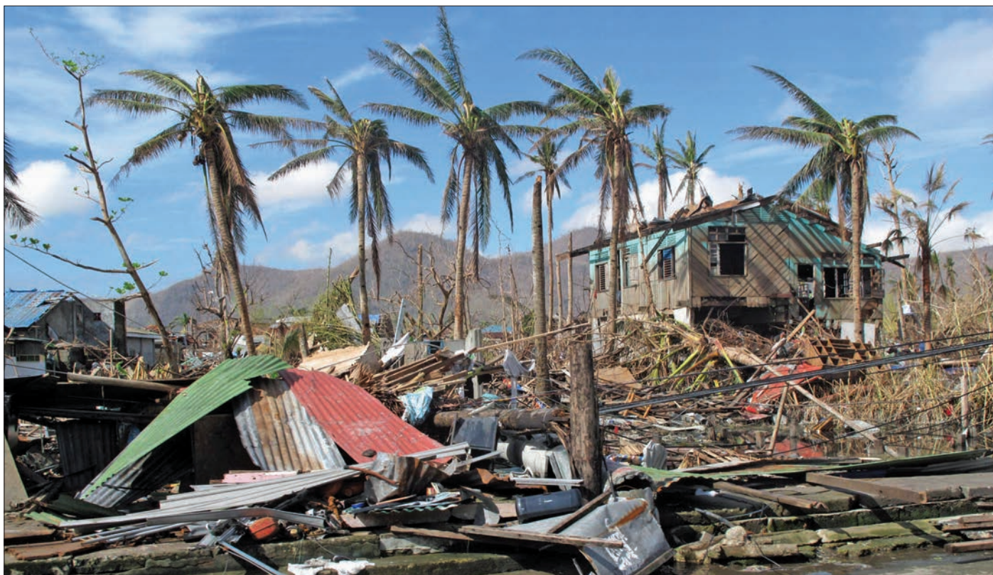
Tadjép tájfun után