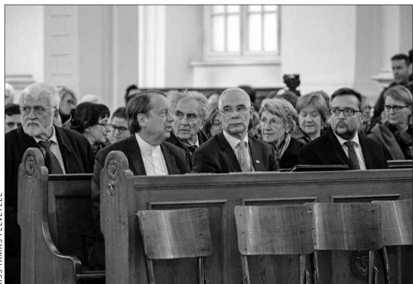
A reformáció emlékévként evangélikus megnyitóünnepsége a Deák téri templomban