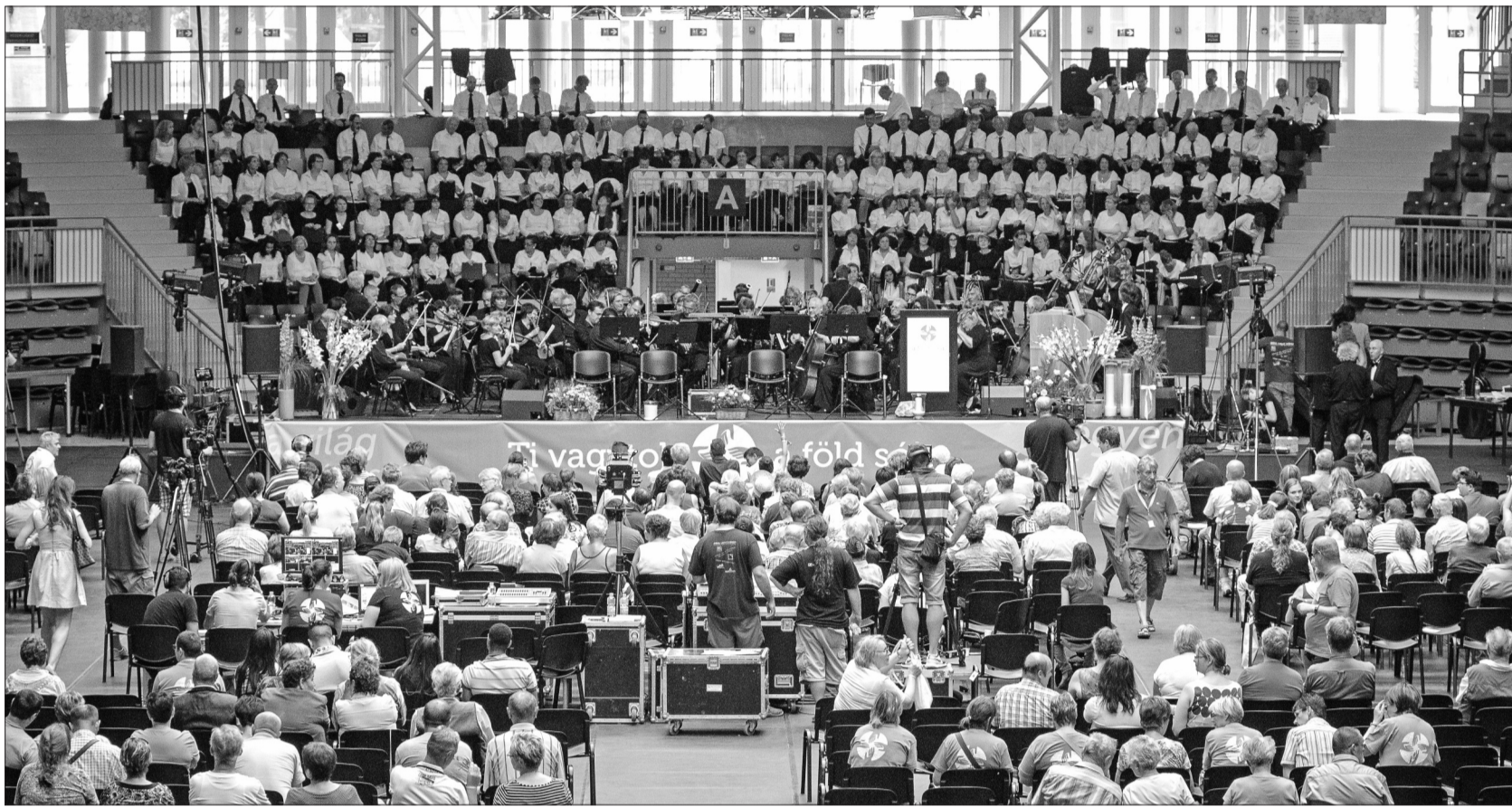
Egyesített kórus adta elő Kodály Zoltán Budavári Te Deum című művét „A föld sója” találkozó szombati záró istentiszteletén