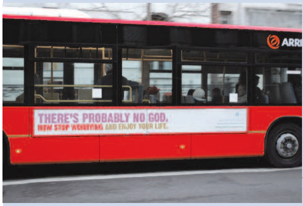
Richard Dawkins kampánya a londoni 25-ös busz oldalán