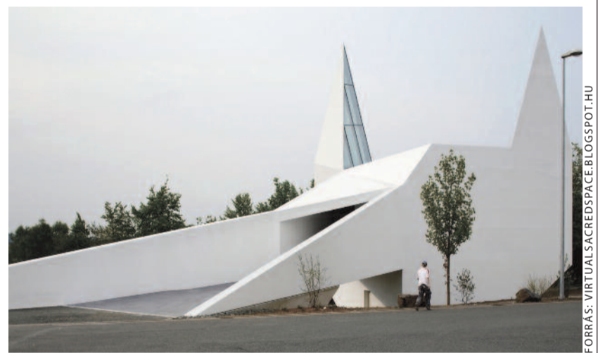
Michael Schumacher a Dillenburg és Siegen közötti autópálya-templomnál