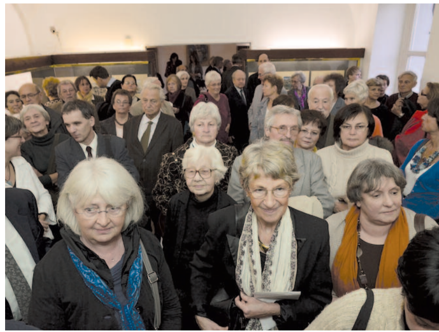
A kiállítás megnyitóján...

ne, de nem teszi, bűne az annak” – végül úgy döntött, elfogadja a megbízást. Hogy jól tette-e, hogy vállalta a feladatot, arról majd az utókor