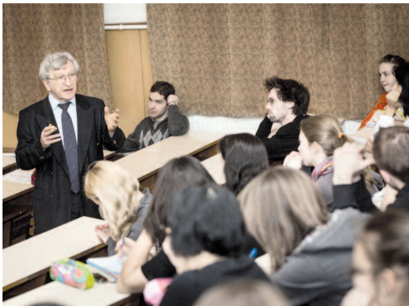
Előadás közben az állatorvos-tudományi egyetemen

További kérdésekre szívesen adok választ honlapomon: http://frenyo.atw.hu .