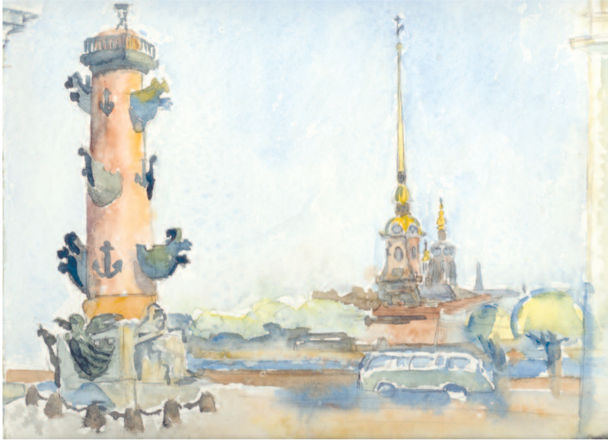
szentágothai jános: szentpétervár (1970)