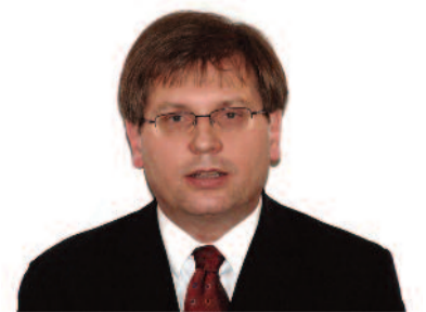
Fabiny Tamás püspök Északi Egyházkerület

– Természetesen. Minden jelentősebb tagegyház megkezdte már a saját felkészülését. Dániában vagy éppen Németországban kormánybizottság is alakult a reformáció méltó megünneplésének előkészítésére. Számos országban – de az LVSZ szintjén is – az a terv, hogy a megemlékezésekre bevonják a római katolikusokat is, hiszen ma elsősorban nem a szakadásról, hanem az egyetemes egyház megújulásáról és egységéről kell beszélünk. Jó látni, hogy kisebb egyházak is milyen jó ötletekkel állnak elő. Magam többekkel tárgyaltam arról, hogy a nálunk készülő Luther-rajzfilm akár nemzetközi koprodukcióvá váljon. ■ EÉ