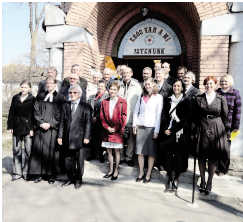
A pestújhelyi presbitérium

Az egyház vállalt küldetése a földre jött emberek üdvösségének szolgálata, amely szolgálatot egyébként tisztességesen, elvárható hatékonysággal működtetett szervezeti keretek között kell megvalósítania. Ebben a konstrukcióban nincs olyan feladat-