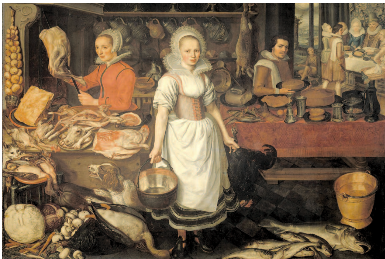
A GAZDAG ÉS LAZAR – FELTÉHŐEN PIETER CORNELISZ VAN RUYCKOOL (1610 KÖRÜL)