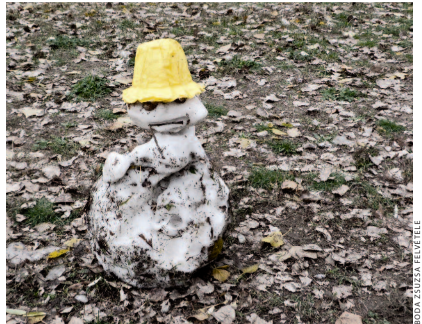
Az idei ősz egyik első hóembere...

Öreg kolostor a vén sziklafal mellett. Két szerzetes söpri a novemberi arany falevelet, másik, meggörnyedt háttal a lehullt gallyat hordja a lobogó tűzre. Sovány arca, mint kódexek pergamenlapjai, nézi a hunyó Nap körül szálló madárcajt. Szótlan szorgoskodnak kint, azután imádkoznak a cella-csőndben odabent: jegyzik a hit ódon-szép szavait. Ikonon istenanya könnye pereg, fapadok nyikorognak a mélybarna homályban, kopott könyv nyílik, s tollat mártanak fekete tintába a gyertyafényben. Újra a kert, az ösvény, döngve bezárul a tölgykapu az alkonyatban.