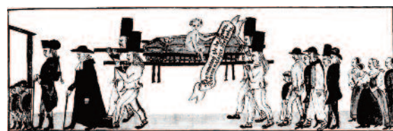
Ecclesia Euangelica Taxoviensis MATRICULAE PARS III. Sepultorum Nomina 5tinens.

inak személyi adatairól a helyi, illetékes felekezetek papjai vezettek nyilvántartást, és adtak szükség esetén erről hiteles tanúsítványt. A 19. század közepéig azonban e tevékenységük nem volt hivatalosan szabályozva, így felkészültségük, érdeklődésük, netán egyházi feletteseik odafigyelése határozta meg, hogy milyen adatokat és milyen rendszerességgel írtak az anyakönyvekbe.