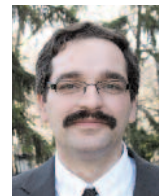
Evangélikus istentisztelet a Magyar Rádióban

ként négy istentiszteletet tartunk, kéthetente gyermekbibliakörökkel, illetve havonta családi istentiszteletekkel. Igyekezünk a gyermek- és ifjúsági munkára nagy súlyt fektetni, ennek egyik gyümölcse az ötödik éve tartó nyarhetyi passiói szolgálat. Gyermekinkkel nyáron táborozunk, télen például betlehemezünk. Mind a négy társgyülekezetben tartunk bibliaórákat. Ezenkívül is sokféleképpen próbáljuk az embereket a gyülekezet közösségében tartani. Hívjuk őket gyülekezeti napokra, énekkarra, színházba, kirándulásokra. Jelenleg is zajlik egy ötfoldos gyülekezet-történelmi verseny.