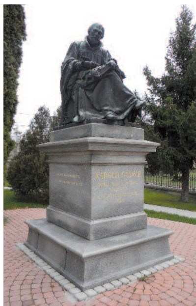
Károli szobra Göncön

Biblia-vasárnap apropójából mi most a Színről színre címet