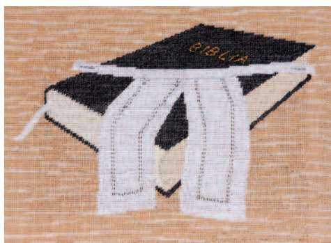
SOLYOM IRENNÉ TEXTILKÉPE

rét. Végül arra jöttem rá, hogy az Ószövetség valójában ráér . Közel ezer esztendő kellett ahhoz, hogy létrejöhessen ez a könyvgyűjtemény, amelyben különböző korokban, más és más helyzetben élő emberek hitvallásai, töprengései fogalmazódnak meg Istenről és a vele létrejövő kapcsolat-