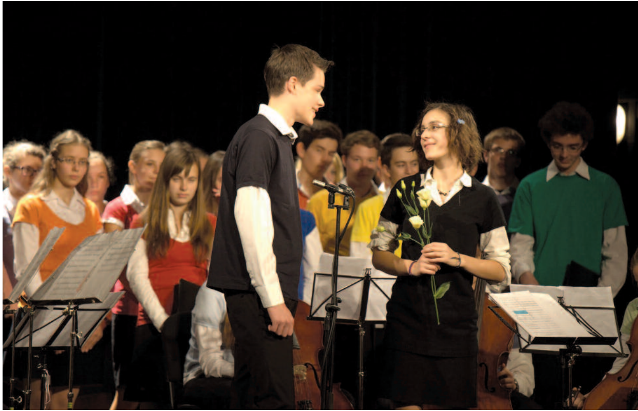
Deák téri gimnazisták irodalmi műsora a filmszínház színpadán

Borsod-hevesi mentőcsomag? ► 3. oldal A Mária-paradoxon ► 5. oldal Anyakönyvi érdekességek ► 9. oldal Zengedező aréna ► 4. oldal Ciki-e Jézust követni? ► 8. oldal Melléklet: ÚTÍTÁRS – magyar evangéliumi lap