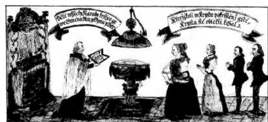
Ecclesia Euangelicae A.C. TAXOVIENSIS MATRICULAE PARS I. Baptifatorum Nomina 5tinens.

Viszonylag gyakran találunk kalligrafikus igényességgel megírt címlapokat új kötetek elején, ám