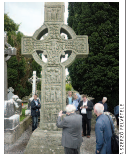
Egy ezeréves kelta kereszt körül Monasterteboice-ban (Ír Köztársaság)

Az augusztus 27-én tartott taggyűlésen a résztvevők arról döntöttek, hogy a 2014-ben esedékes konferencia helyszíne Budapest legyen. Öröm és elismerés ez a döntés. Gondolhatunk arra, hogy hazánkban 1943-ban alakult meg az Ökumenikus Tanács, öt évvel az Egyházak Világtanácsa előtt, vagy hogy a magyar egyházak éppen tíz éve, 2002. október 1-jén Európában másodikként írták alá az Európai ökumenikus char-