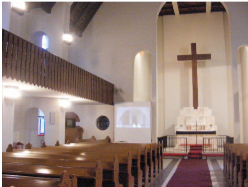
Az óbudai evangélikus templom

na mellől is megszemlélni a templombelső, sőt a toronyba is felmászhat, aki bírja az ingatag fatákolmányokon való közlekedést. Gyerekek, idősek egyaránt nekiveselkednek, másznak a félhomályos terekben, mikor egy lépcsőfordulóban összezsúfolódnak, udvariaskodnak, mosolyognak. A harangon túl már kissé szürreális a kirándulás a madártetem-maradványokkal, harisnyaszaggató kiszögellésekkel. Aki ide is felmereszkedik, az csöpp-