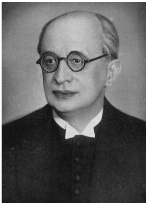
Dr. Ravasz László (1882–1975)

megfordultam. Később a filmgyárban kaptam feladatokat, majd a televízióban dolgoztam. Itt fordulóponthoz