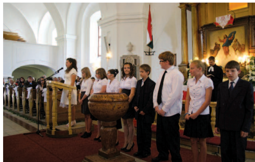
Konfirmációs vizsga Pilisen (2012)

Az előbbi listából a lelki felnőtté válás maradt csak ki, és nekünk erre a hiányra fokozottan érdemes figyelniük.