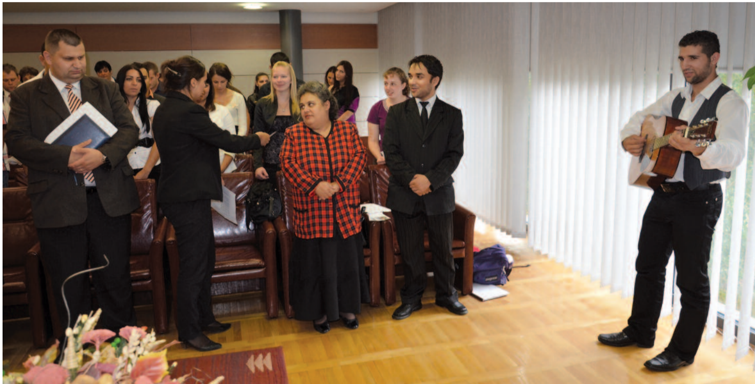
Tánévnyitó a nyíregyházi Evangélikus Roma Szakkollégiumban

Az egyház egységének vasárnapja ► 2. oldal „Egyházunk jövője az iskolapadokban van!” ► 7. oldal Konfirmáció és evangélikus nevelés ► 8–9. oldal Interjú dr. Ravasz László unokaöccsével ► 10. oldal Jerikó rózsája ► 11. oldal Szelíd vadak ► 15. oldal