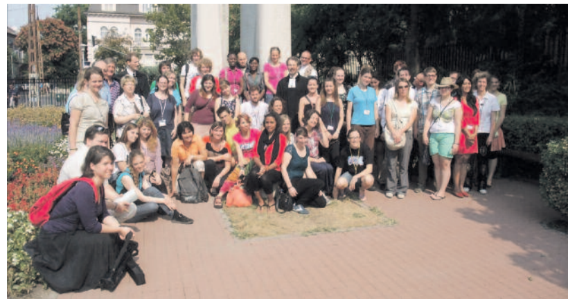
Protestáns fiatalok a faszori evangélikus templom melletti Reformációi emlékparkban

Egy mexikói fiú bátyja bandahörvű áldozata lett. Gyilkosaival később szintén egy drogbanda végzett, s a fiú családja megelégedettséget érzett a „bűnhődés” láttán, ám ő maga tudta, hogy az erőszakra nem lehet gyűlölettel válaszolni, és ezt el is mondta egy családi találkozón.