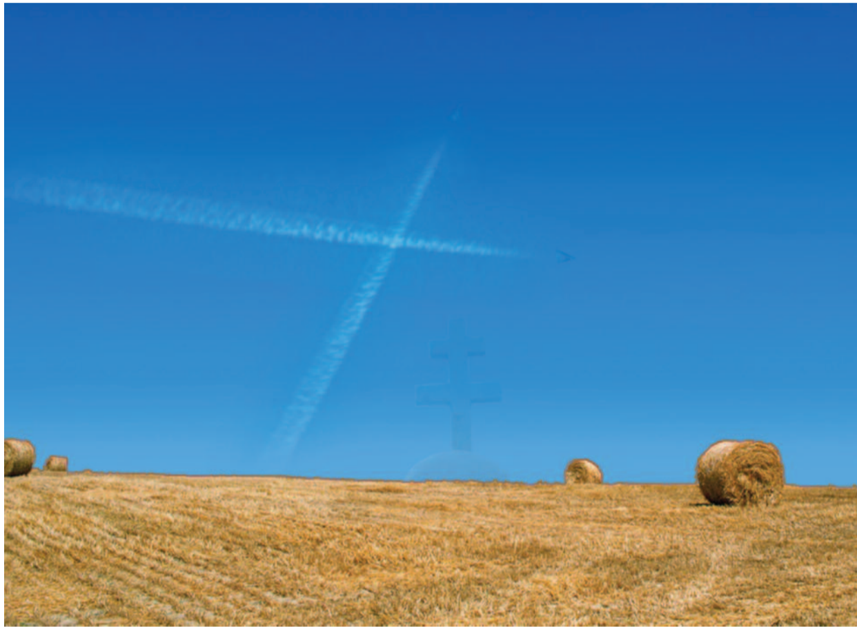
KAROLY GYÖRGY TAMÁS MONTAZSA

Hogyan ünnepeltek a protestánsok? ▶ 5. oldal Találkozások Böjte Csabával ▶ 16. oldal Interjú az új kerületi felügyelővel ▶ 18. és 23. oldal Bibliai tudáspróba ▶ 24. oldal Szélrózsza-visszapillantó ▶ 26. oldal Melléklet: ÚTTITÁRS – magyar evangéliumi lap