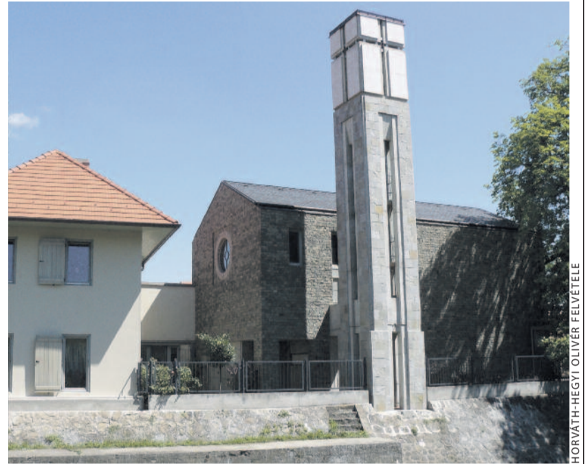
A szentendrei evangélikus templom és parókia

A Szentendrei séták című prospektus, amely negyvenöt múzeumot, galériát, műemléket sorol fel, az