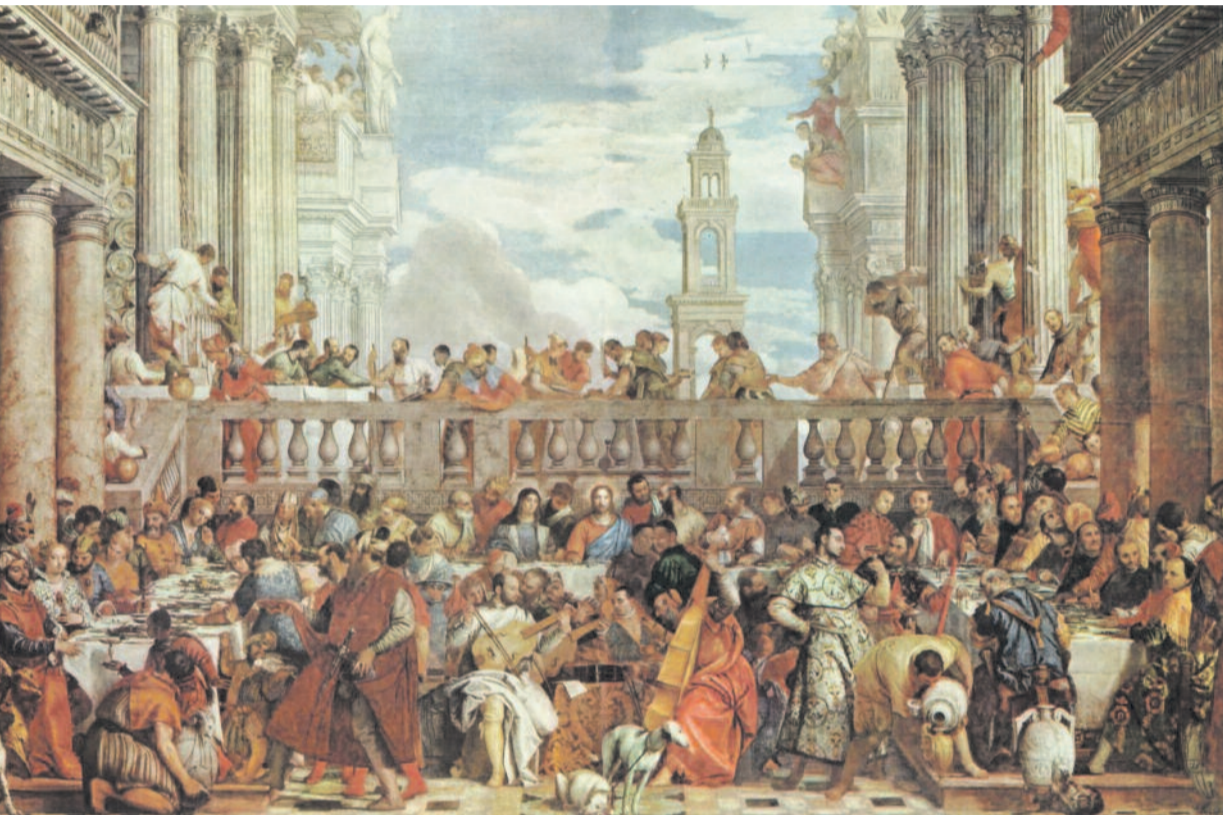
PAOLO VERONESE: KÁNAI MENYEGZŐ