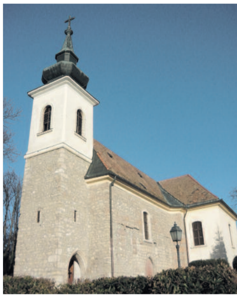
A cinkotai evangélikus templom

gezzenek hazai templomokon. Halaváts Gyula 1912-ben nyolc mérést közölt. Erdei Ferenc és Kovács Béla 1964-ben huszonnégy mérést publikált. A kérdést legkomolyabban Guszik Tamás építésztörténész kutatta: több, 1975–1980 között megjelent