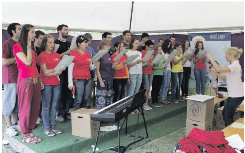
A szombati koncert

tunk azokra is, akik kevesebb zenei előképzettséggel bírnak. Nekik viszonylag egyszerűbb dolgokat állítottunk össze. A zenei csokorból azután kiválasztottuk, hogy mely darabok hangozzanak el a záró istentiszteleten. A próbákon ezekre fókuszáltunk.