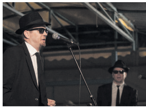
Blues B. R. Others