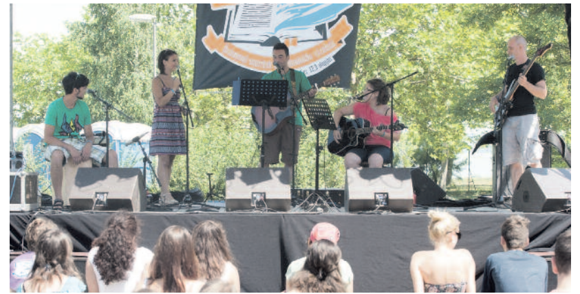
HMIK Band – A Hétfalusi Magyar Ifjúsági Klub együttese Erdélyből

Vegyük csak példaként a kőszegi ifisek alkotta Echo zenekart! Tizenhat két évtizedben „untig énekeltek” ifjúsági énekből áll. Kitűnő zenei érzékkel hozzájuk nyúlva azonban, íme, sikerült rehabilitálniuk többek között a Róla beszél fű , virág és a Boldog mosoly az arcomon kezdetű, persze