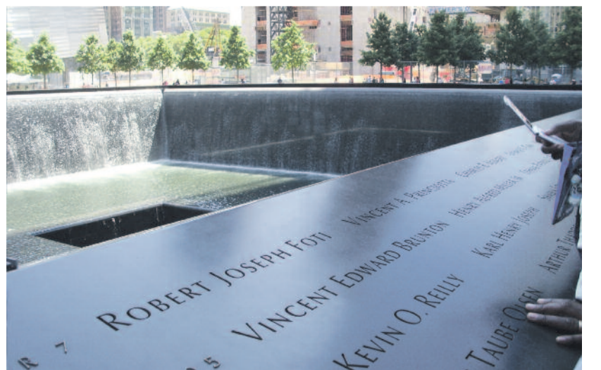
Zero Ground – emlékhely az áldozatok neveivel