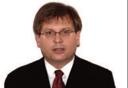
Fabiny Tamás püspök Északi Egyházkerület