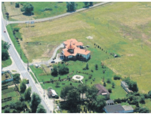
A Filadelfia gyülekezet temploma – madártávlatból

Évekig tartó tervezés és gyűjtés mellett mesés adományok és az országos egyház támogatása is segítette a megvalósulást, így 2005-ben felszentelhetők a gyülekezet korszerű központját, mely tudatosan úgy épült, hogy ne csak az istentiszteletek méltó helyszíne legyen, de tere lehessen benne minden munkálkodásuknak.