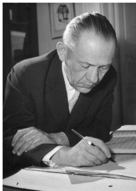
Lajtha kottát ír

► Nagy zeneszerzőnk küzdelmes életéből nekem a párizsi évek tetszenek a legjobban. Lajtha László (Budapest, 1892. június 30. – Budapest, 1963. február 16.) a francia fővárosban azt csinálta, amit igazán szeretett: új műveket komponált, vezényelt, és előadásokat tartott. Mégis mindig hazakészült. Barátai figyelmeztették, hogy Magyarországon zsarnoki hatalom teszi a törvényt, mégsem hallgatott rájuk. „Magyar vagyok, otthon a helyem!” – válaszolta megfellebbezhetetlenül.