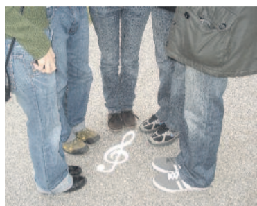
Lá(b) – pentatónia Doborján főutcáján