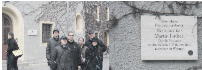
A weimari Liszt Ferenc Zeneakadémia (balról) és a volt ferences kolostor (jobbról), itt élt 1518-ban Luther Márton. A reformátor több alkalommal is megszállt Weimarban 1518 és 1540 között.