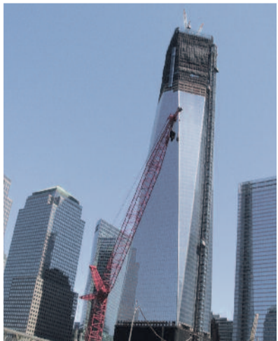
Épül a Freedom Tower

Az emlékparkba a női konferencia résztvevőit is elvitték. S bár a kapuban hatalmas táblán figyelmeztették a tu-