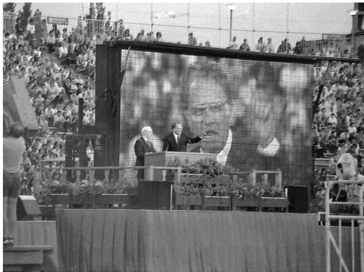
Népstadion, 1989. július 29. – Billy Graham evangélikációja

Fél hatra gyakorlatilag megtelik a stadion, már a fűre, a küzdőterre is beengedik az embereket: főleg fiatalok tódulnak le a gyeprre, ahol egykor Puskás Öcsi vagy Albert Flóri rúgta a labdát. Fél hétkor, amikor az első közönséges és imádságok elhangza-