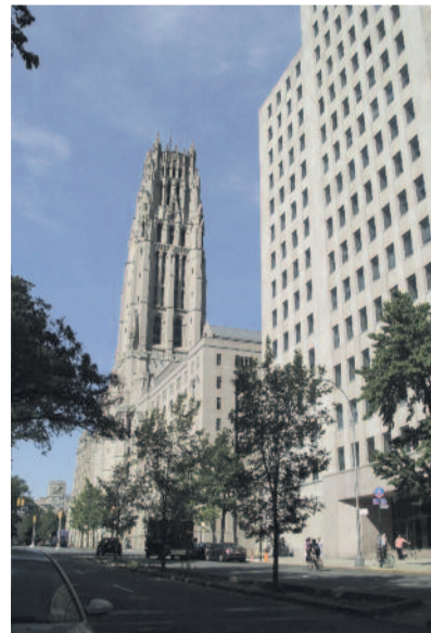
Az Interchurch Center épülete

Ma már a világimanapi mozgalom lelkes munkatársa, sőt éppen ezen a New York-i gyűlésen bízták meg a