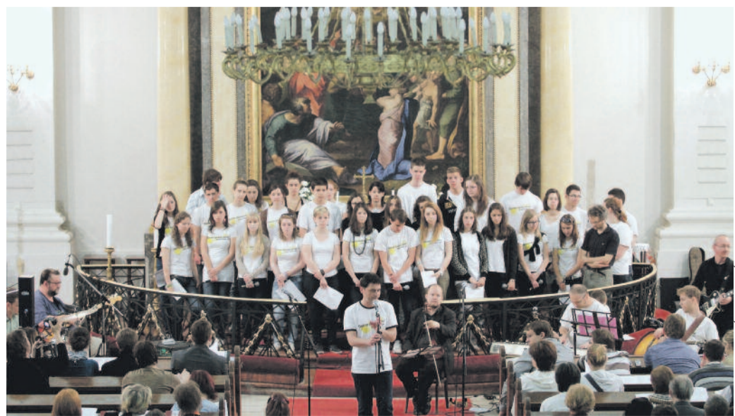
A Jónás és Jézus pünkösdhétfői előadása a Deák téri templomban