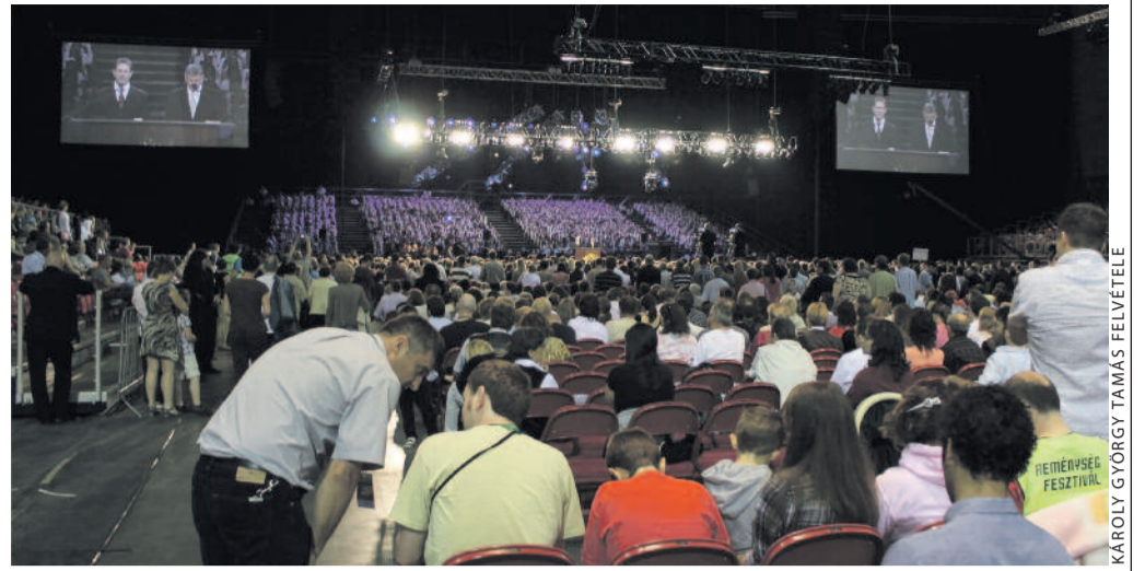
Papp László Budapest Sportaréna, 2012. június 3. – Franklin Graham evangélikációja