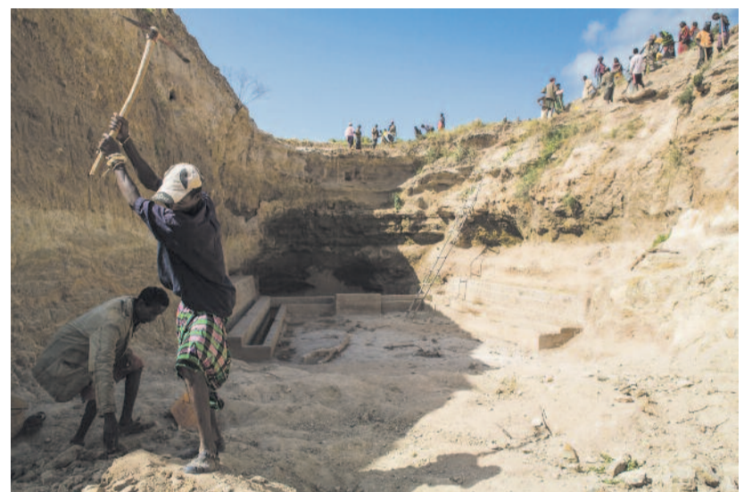
Épül Gayóban az ella