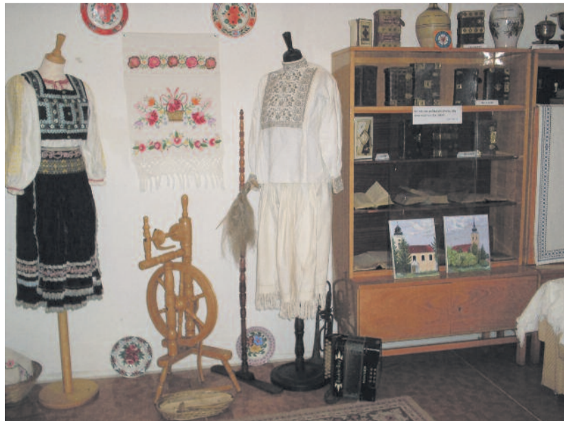
A nagykürtösi helytörténeti kiállítás részlete