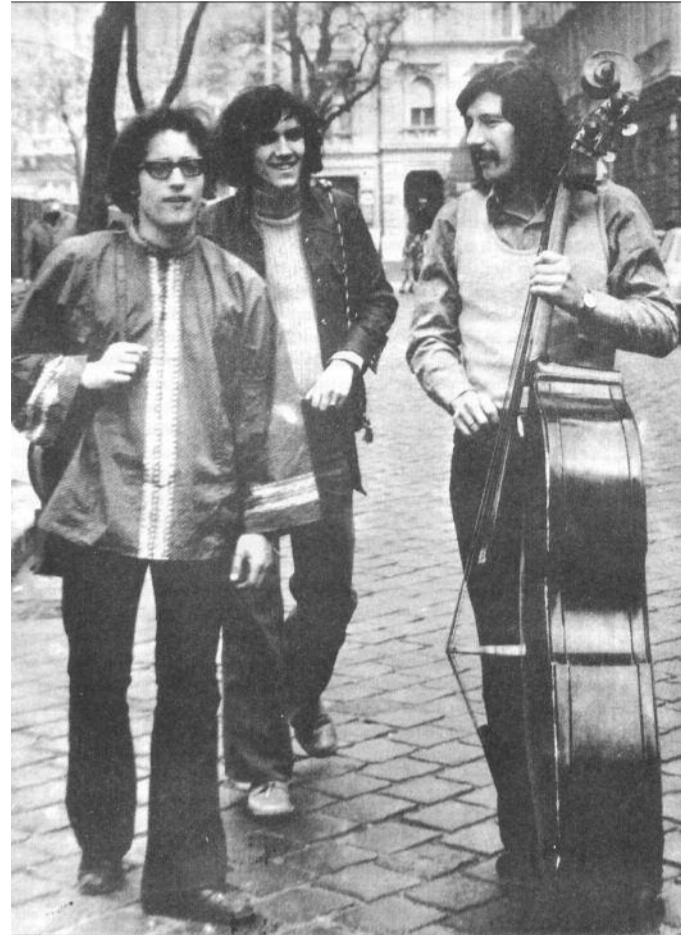
A Sebő-együttes 1975-ben

▶ Az alapítók, az emlékezők szerint negyven éve, május 6-án tartották az első magyar táncházat. Budapesten, az Írók Boltja egyik kis termében gyűltek össze fiatalok, hogy néhány órára megidézzék a népdalok gyönyörű világát. Természetesen a néptánc és népdal felfedezése nem egy pillanat műve volt, hosszú évtizedek fáradságos munkája kellett hozzá: az elődök – Vikár Béla, Bartók Béla, Kodály Zoltán, Lajtha László – magvetése és az utánuk jövők nem szűnő lelkesedése.