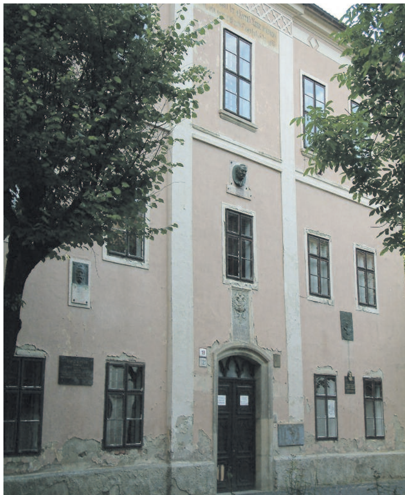
A késmárki liceum régi épületének bejárati része

Johann Genersich igen termékeny szerző volt, művei kora német szellemi életének alapos ismeretében alkotta. Legeredetibb művei az ifjúság nevelésével, szellemi és erkölcsi nemesítésével foglalkozó didaktikai művek, melyek a felvilágosodásból kihajtó pedagógiai-antropológiai irány-