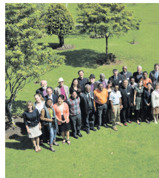
Az LVSZ tanácsa és a szakértők

tiszteltetés ér, hogy a város legnagyobb evangélikus gyülekezetében hirdethetjük igét. Amíg gyülekezünk, az egyik jelenlevő Puskás Öcsiről kérdez, egy fiatal pedig Rubik-kockával a kezében érkezik a templomba.