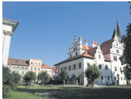
A négyszintes Spillenberg-ház a löcsei városháza mögött

A kolostor átadására nem került sor, ezért a hatalom arroganciája ér-