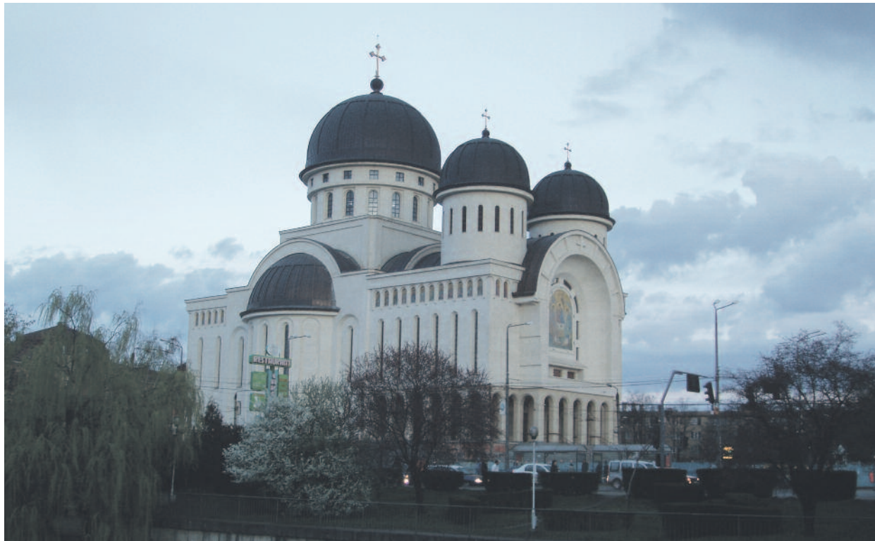
Az aradi ortodox katedrális

Kérdésünkre hozzáfűzte, különösebb botrány nem kísérte az építkezéseket, hiszen az önkormányzat általában gond nélkül hagyta jóvá a templomok építési engedélyt, illetve bocsátotta az ortodox egyház rendelkezésére a kért telkeket, így az-