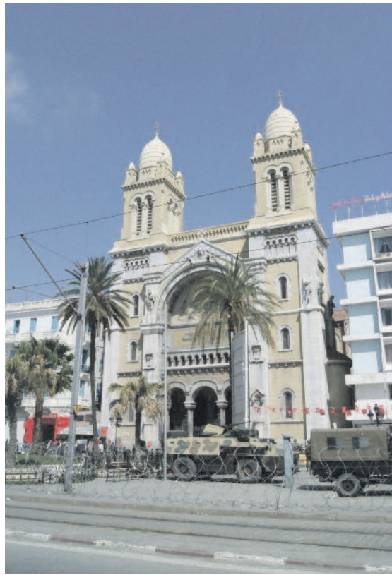
A tuniszi Szent Vince-katedrális

– A keresztény egyházakkal nagyon jó a viszonyunk. A mindegyikünket érintő kérdésekben gyakran cserélünk véleményt, s az egyeztetések nyomán alakítjuk ki közös álláspontunkat. Konferenciák alkalmával felkerjük egymás vezetőit előadások tartására. A néhány ezer tagot számláló zsidó közösséggel is példás az összhang, a tuniszi rabbival nagyon jól megértjük egymást. Sajnálatos számunkra is, hogy a forradalom után zsidó testvéreink száma tovább csökkent. Mint már említettem, Tunéziában az iszlám igen toleráns. Az iszlám hitűekkel is számos eszmecserét, dialógust folytattunk. A tunéziai átlagpolgár igen művelt, s e párbeszédben az értelmiségnek vezető szerep jut.