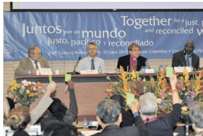
Szavazás a plenáris ülésen

Június 17-én, vasárnap a tanács tagjai Bogotá különböző evangélikus gyülekezeteit látogatják meg. Az a meg-