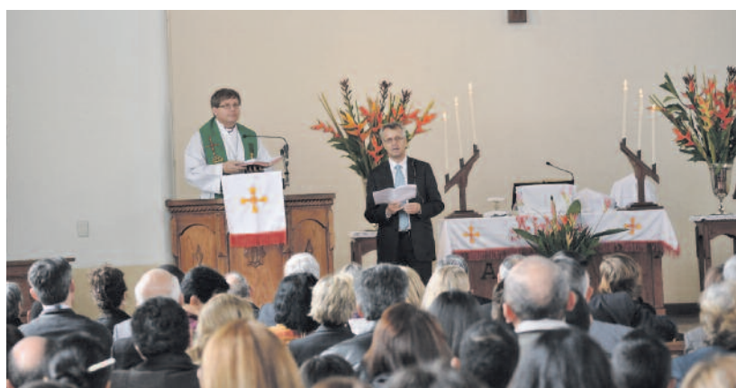
Istentisztelet a Redentor-templomban

nyolra. Az úrvacsorát megelőzően meg kell áldanom a nagyszámú gyereksereget. Amint karomat felemelem, ők is magasra tartják kis kezü-