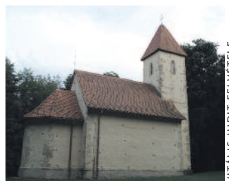
A veleméri Szentháromság-templom

Közvetlenül a szlovén határ mellett található Szalafő-Pityerszer, amely az Őrség legrégibb települése. A falu mára már lényegében néhány házból álló skanzennek tekinthető, ahol egy fél napot eltöltve megismerheted az Őrségi szerek kincseit.