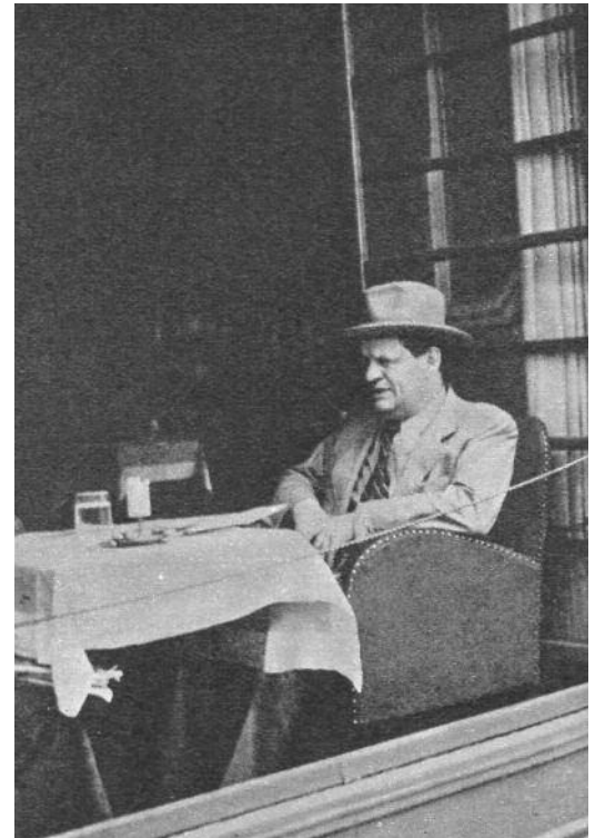
A Parissete kávéház asztalánál...

Nyomasztotta a kizöklent idő, a reménytelenség élménye: „itt vagyok az Elhagyatottság Harmincadik / Szélességi, a Szégyen / Századik Hosszúsági / s a fogatösszeszorító Dac / Végső Magassági Fokán, valahol messze vidéken / És kíváncsi vagyok, lehet-e még jutni előbbre.” Bántotta az önkínzó magány, az