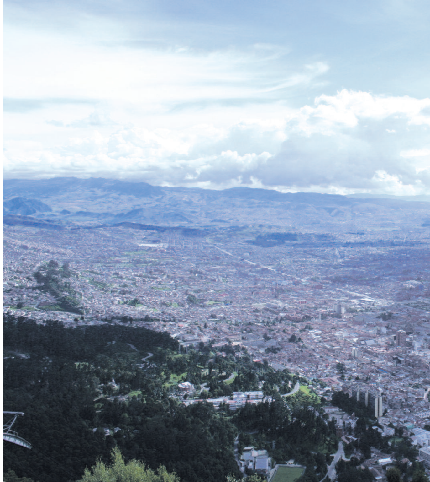
A kétezer-hétszáz méter magasan fekvő, nyolcmillió lélekszámú főváros, Bogotá

Tanácskozásunk helyszíne a katolikus egyház konferencia-központja. Köszönhetően a zárt és őrséggel védett területnek itt biztonságban vagyunk, de elég a szobánk ablakán kitekinteni, hogy szembesüljünk a mindennapok realitásával. Mellettünk ugyanis egy hatalmas női bör-