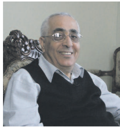
Maroun Lahham érsek

– A fiatalok legnagyobb része afrikai egyetemista, akik tunéziai egyetemeken tanulnak. Legtöbbjük dinamikus, befogadó ember. Az életöröm jellemzi őket, erről Ön is megbizonyosodhat a vasárnapi miséinken. Könnyen beilleszkedtek az egyház, a plébániák életébe, kórusokban, karitatív munkában szolgálnak a közösséget. De nem tekinthetünk el attól, hogy a keresztények java része