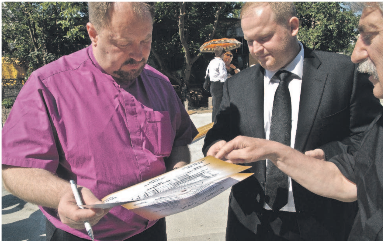
Püspöki alaprajzszemle – Evangelikus templom épül Besztercén...

A másokért élő egyház ► 2. oldal 200 éve választották püspökké Kis Jánost ► 4. oldal Isten szeretetének szolgálatában ► 5. oldal Czigány Györggyel – Weöres Sándorról ► 7. oldal Egyházjog Luther hazájában ► 8. oldal Evangelikus hölgyválasz a „múzeuméjszakán” ► 10. oldal