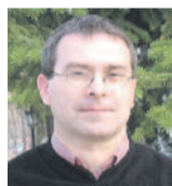
Evangélikus istentisztelet a Magyar Rádióban

Településeink lélekszámával együtt az evangélikus közösség is folyamatosan fogy, de egy kis énekkar megalakulása, a templomba járók és a hitanosok lelkesedése mutatja, hogy Isten segítségével van, lehet jövője ennek a kis gyülekezetnek.