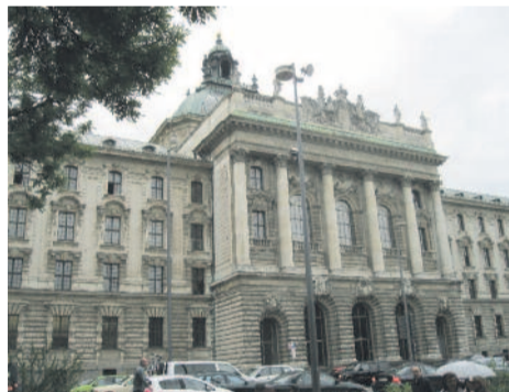
Az igazságügyi palota kívülről