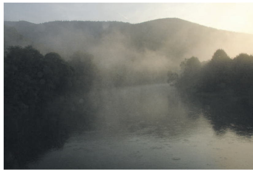
ÁRVA FOLYÓ – „DEZSŐ GALÉRIA”