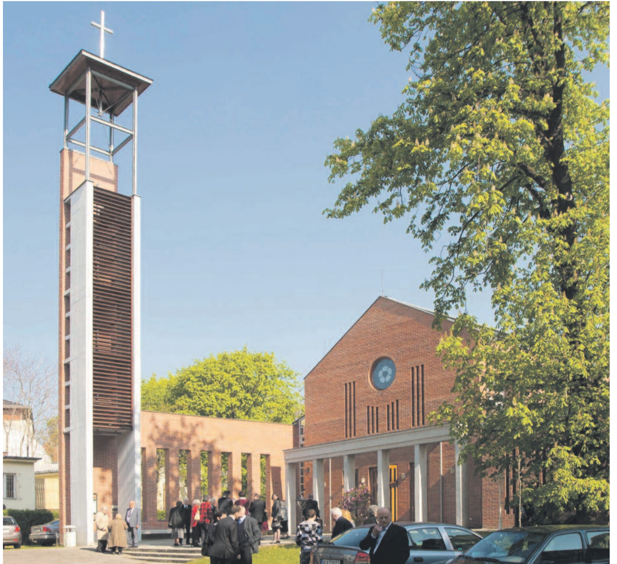
A Benczúr László által tervezett budahegyvidéki evangélikus templom

Igen, ez a mérték és mérce, a morális megállás: hogy tudjuk-e, mire kötelez a hivatal, és mire nem hatal-