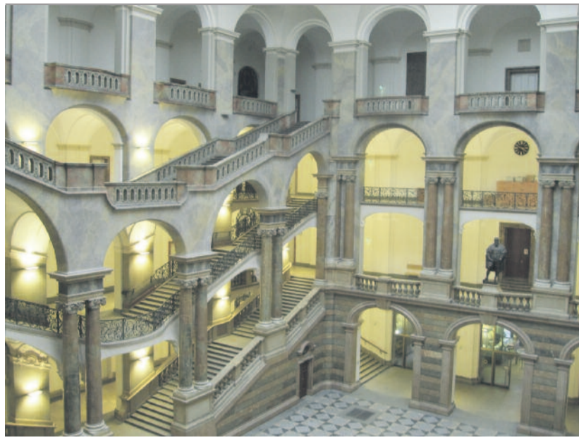
A müncheni igazságügyi palota aulája

► Egyházi, illetve állami egyházi kérdésekkel foglalkozó szemináriumot rendeztek június 3–8. között a bajorországi Pullachban. A tanácskozás főszervezője a Németországi Egyesült Evangélikus Egyház (VELKD) központi irodája és annak egyházi intézete, valamint a pullachi tanulmányi ház volt. Ez utóbbi egyházunk jól ismert piliscsabai vagy szárszói konferencia-központjához hasonlítható.