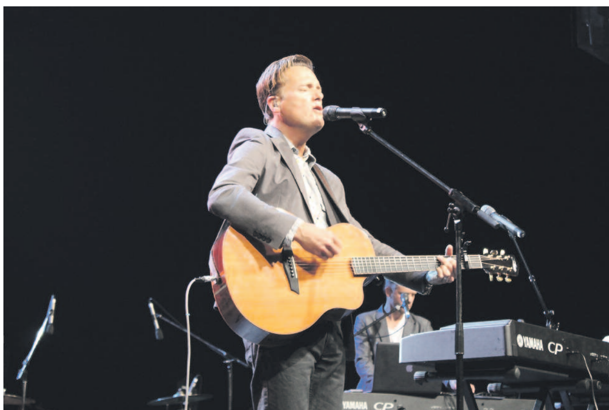
Michael W. Smith

»...HOGY MINDNYÁJAN EGYEK LEGYENEK... HOGY ELHIGGYE A VILÁG...«