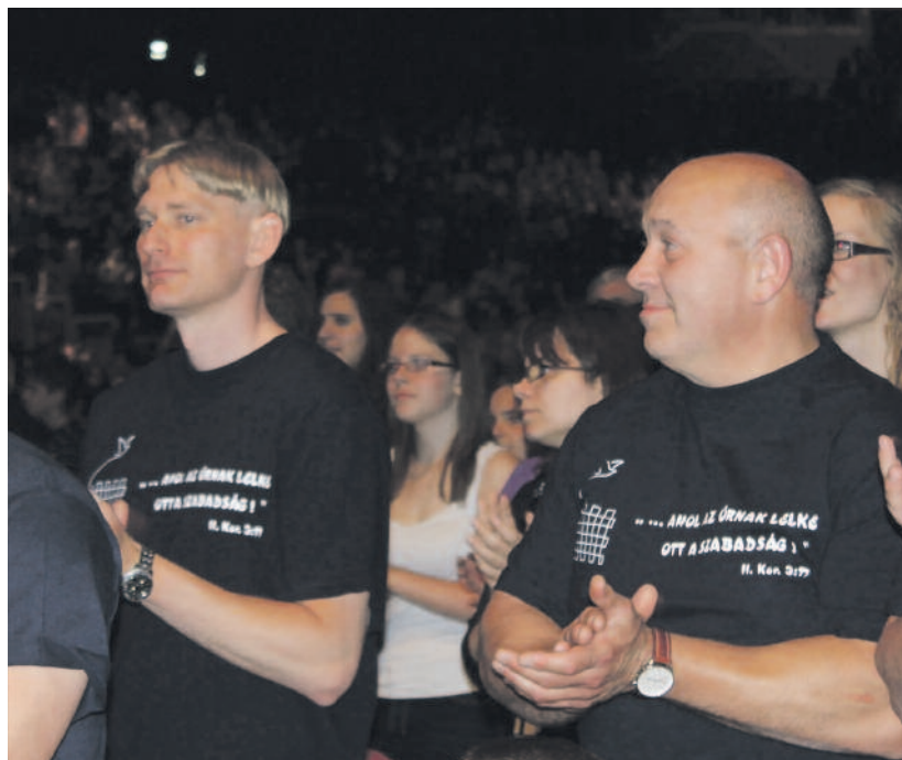
„...ahol az Úrnak lelke, ott a szabadság” – váci fogvatartottak