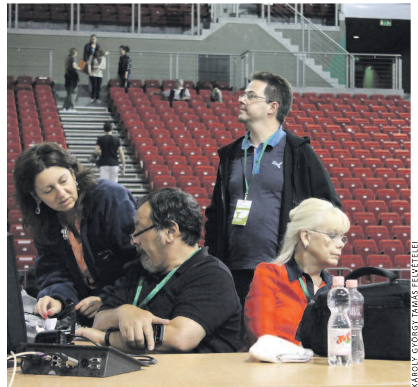
Nélkülük nem lett volna fesztivál – néhányan a technikai személyzetből