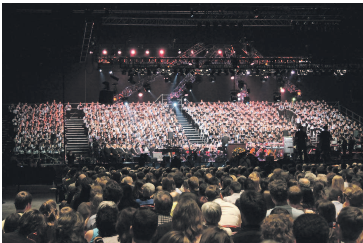
A közönséggel szemben az ezerfős kórus és a szimfonikus zenekar

■ NYIKITA (Teljes név és cím a szerkesztőségben)