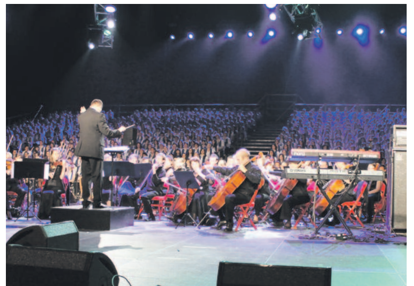
Ezertagú kórus és ötvenfős szimfonikus zenekar