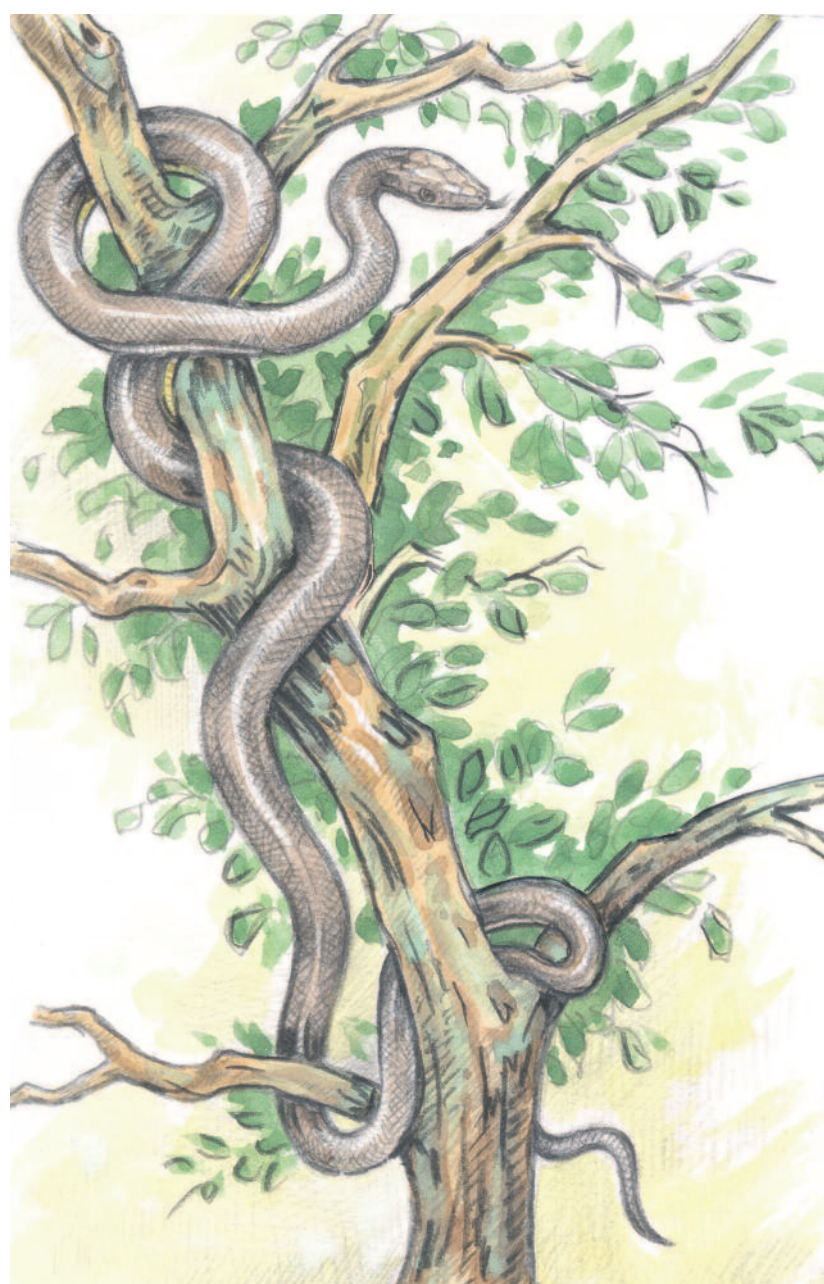
RAJZ: BUDAI TIBOR

Az erdei sikló tojásokkal szaporodik, a nyár első felében a laza földbe vagy az avar alá rejtli őket. A kis kigyók általában szeptember elején