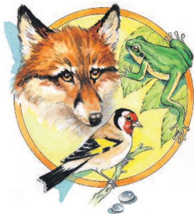
MESÉLNEK AZ ÁLLATOK

A badacsonyi szőlőben az egyik repkénnyel befuttatott ház oldalán egy falmélyedésben házi rozsdafar-