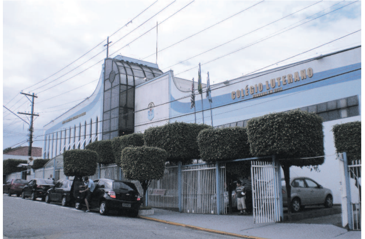
Evangélikus templom és gimnázium São Paulóban

lelőssé” Rio de Janeiro államban, és már majd egy évtizede kitart a fogadalmal mellett... Gazdag keresztények nálunk is vannak, de el tudunk-e kép-