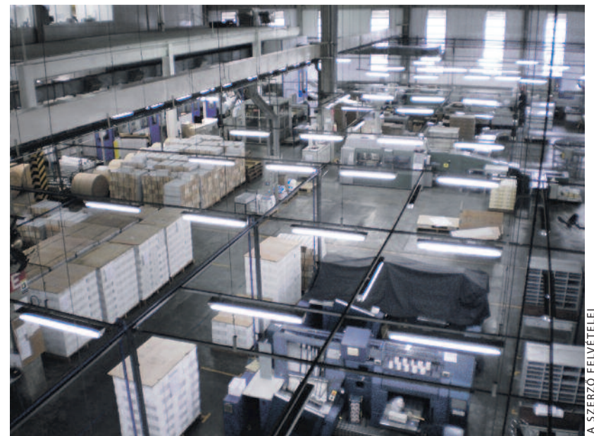
Bibliák Dél-Amerikának – a Brazil Bibliatársulat nyomdája

A szerző református lelkész, a Magyar Bibliatársulat főtikára