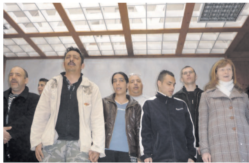
Bizonyságtevők a Görögországi Külterületi Cigány Misszióból

Ha már tudatosan nem tudtuk összeszervezni a Filadelfia Evangélikus Egyházközség és a Budaörsi Evangélikus Egyházközség hétvégéjét, a mi mennyei Atyánk egy adminisztrációs hibát engedett meg, hogy ez mégis létrejöjjön. Egymástól függetlenül, teljesen eltérő célcsoporttal és célkitűzéssel szerveztünk programot a március 9–11-i hétvégére. A budaörsiek munkamegbeszélést készítettek tartani (30-40 fő), a Filadelfia pedig gyülekezetépítő családós hétvégét (80 fő). A nagy felismerés együtt gondolkodásra biztatott, és ahol csak lehetett, találkoztunk a két programot. Hétvégénknek a Párbeszéd Istennel – A kijelentést váró egyház címet adtuk.