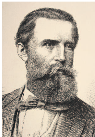
Orlay Petrich Soma arcképe 1878-ból

► Mostanában – és egyébként is – sajnálatosan igen keveset lehet hallani Orlay Petrich Soma nevét. Pedig történelmi festészetünk úttörő mesterét tisztelhetjük benne. „Lelkéből meríti a tárgyakat, rajza minden vonásában teremtő lelkét látja visszacsugározni – költészetében megtestesíti az istenséget, kivitt eszméje nagyszerűségével megrázza a lelkeket” – írta egy cikkében a romantika és klasszicizmus ötvözésének szellemében Orlay művészi szándékait jellemezve Pap Gábor, a festő egykori diák-társa, a későbbi püspök.