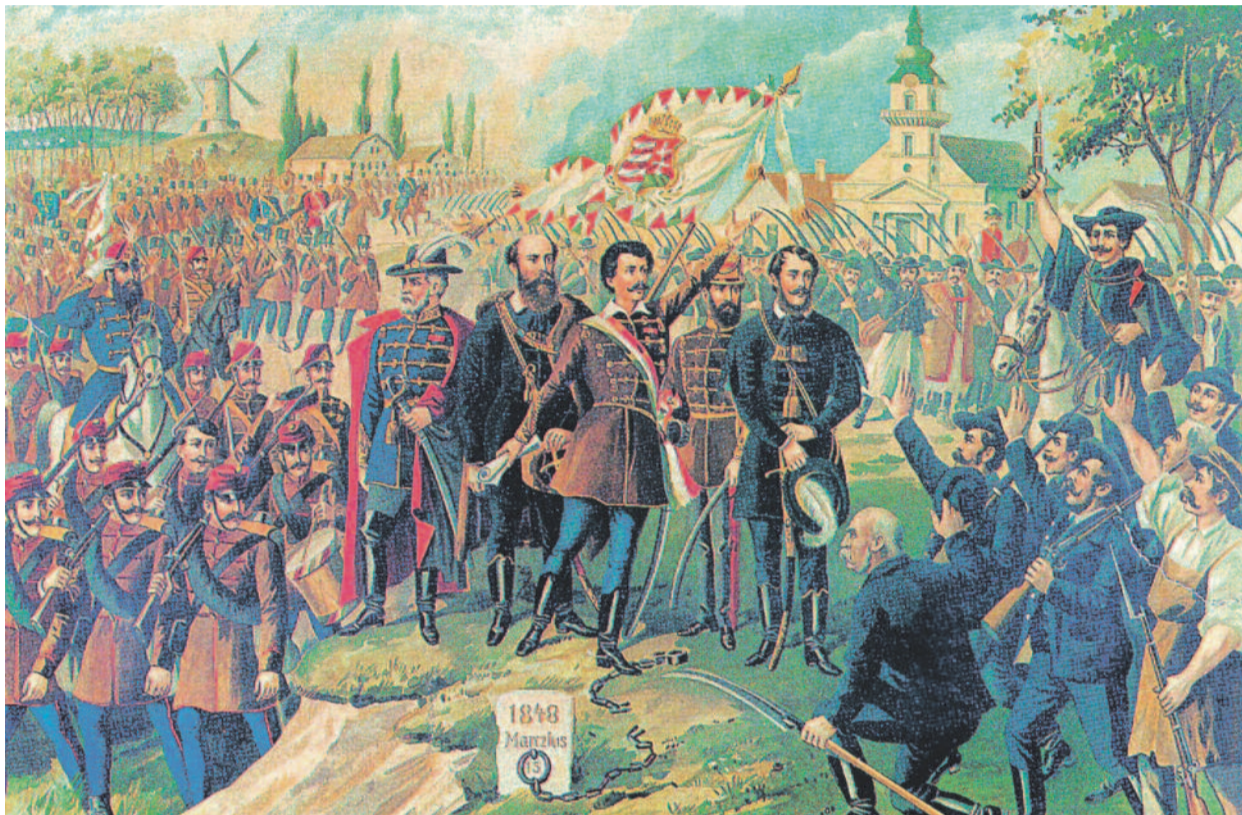
Forradalom és szabadságharc 1848–49-ben. Bellony László festménye. Előtérben a korszak két meghatározó (evangelikus) személyisége: Petőfi Sándor és Kossuth Lajos