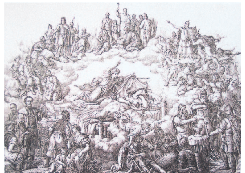
Orlay Petrich Soma – Marastoni József: Emese álma . 1864. Magyar Nemzeti Múzeum Történelmi Képcsarnoka, Budapest

A művész munkásságát számos alkotás fémjelzi Szent István ébredé-