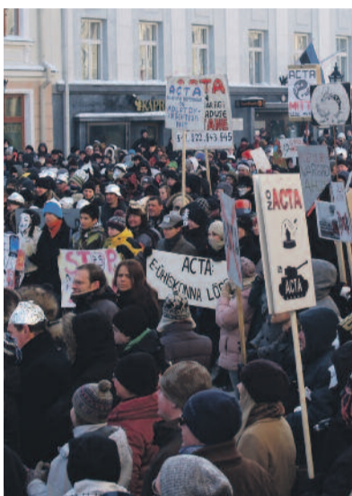
ACTA-ellenes demonstráció Tartuban, Észtországban

„Az internet korában társadalmainkat gyakran »információs társadalomnak« nevezük. Az információ áramlásának szabadsága ma már olyan demokratikus követelmény, mint korábban a szólásszabadság. Az információhoz való hozzáférés, az információközlés szabadsága, az információ szabad áramlása létfontosságú kritérium egy demokratikus társadalomban. Ha bármely hatalom elkezd manipulálni, korlátozni az emberek publikációs szabadságát, illetve az internetes tartalmakhoz, webhelyekhez való hozzáférést, azzal ugyanazt teszi, mint Kína az állampolgáraival” – áll a