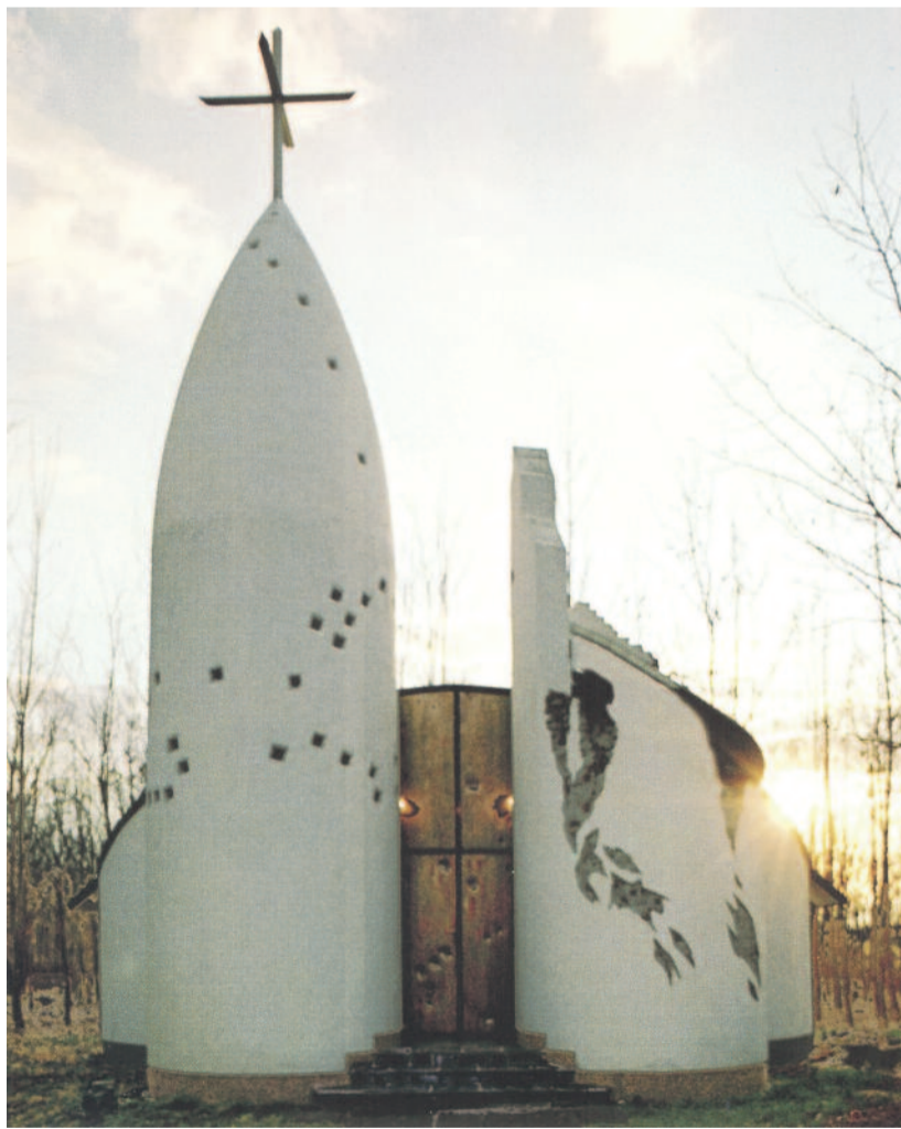
56-os kápolna Kiskunmajsa-Marispusztán