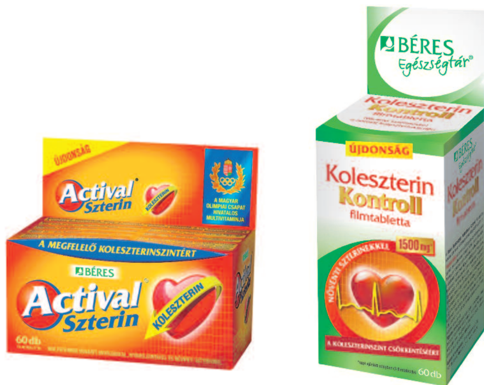
Az Actival Szterin filmtabletta és a Koleszterin Kontroll filmtabletta étrend-kiegészítő készítmények.

A Béres Koleszterin Kontroll filmtabletta növényi szterineket tartalmazó étrend-kiegészítő készítmény. Alkalmazását kifejezetten azoknak ajánljuk, akik a normál értéket (5,2 mmol/l) meghaladó összcholesterol-szintjüket természetes módon szeretnék csökkenteni. A Béres Koleszterin Kontroll filmtabletta csak növényi szterineket tartalmaz, így a fogyasztó az ajánlott napi adaggal (3 filmtabletta) kedvező áron elérheti a kívánt 1500 mg növényiszterin-bevitelt. A filmtabletta alkalmazása azoknak nyújt segítséget, akik a specifikus diétájuk kiegészítésével – de még a gyógyszeres kezelés szükségessége előtt – szeretnék koleszterinszintjüket a megfelelő szintre csökkenteni. A készítmények gyógyszerárakban megtalálhatók 60 db-os kiszerelésben.