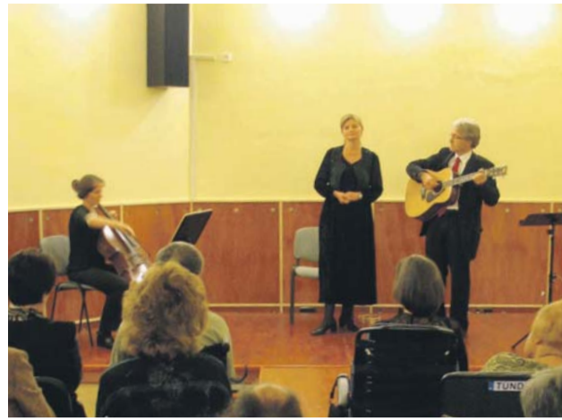
A Poézis együttes

A többségében fogyatékos emberek számára rehabilitációt, munkát és otthon is nyújtó intézményben nemcsak asztalosműhely, nyomda és uszoda működik, de tor-