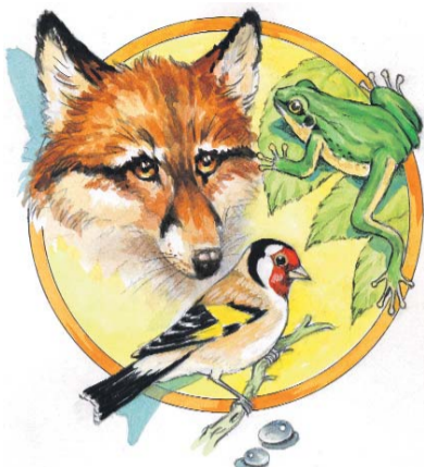
MESÉLNEK AZ ÁLLATOK

Egy alkalommal a szegedi Fehértón figyelhettem meg, hogyan fogott el egy kenderikét. Hosszú percekig ült egy kis fa csúcán, és figyelte a fűben keresgélő csapatot, aztán hirtelen elrúgta magát, és közéjük vágott.