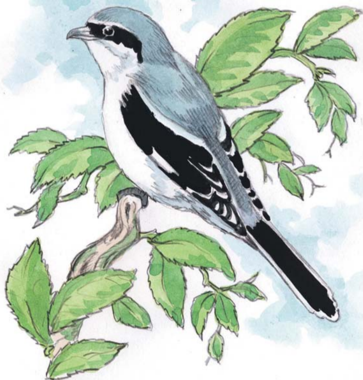
RAJZ: BUDAI TIBOR

A gébics szokása, hogy zsákmányukat tövisre tűzik. Afféle spájz ez a szűkösebb időkre. Persze csak akkor, ha a mindenre figyelő varjak és