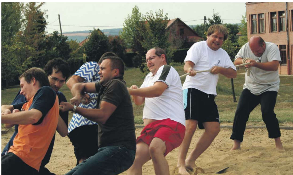
A kötélhúzó versenyt a lelkesek csapata nyerte meg – nem hiába, az egyfelé húzás jegyében a legösszeszokottabb csapat ők voltak.

Az eredményhirdetést követően dr. Fabiny Tamás püspök örömmel jelentette be, hogy az egyházkerület anyagiilag támogat két csapatot egy-egy garnitúra mez beszerzésében. Így a nyertes lucfalvai gyülekezet, illetve a nyírteleki Filadelfia gyülekezet cigányválogatottja két év múlva, a 2013-as sportnapra már az addigra jól bejáratott új mezekben érkezhettek.