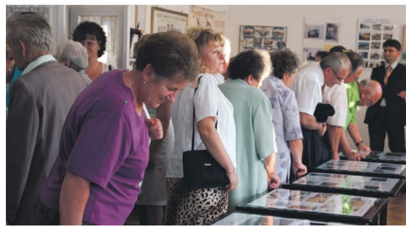
Közszemlén háromszáz év tárgyi emlékei