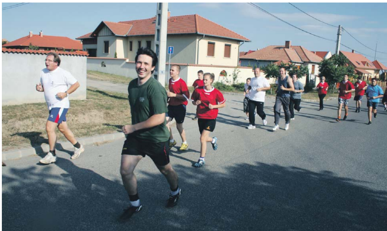
A sportesemény a mindenkit egyszerre megmozgató Luther-mérfölddel (1517 méter) kezdődött. A Gödöllői-domb-ság szélén fekvő Galga-völgy lankás terepének nem minden métere bizonyult könnyűnek...

A vállalkozó szelleműek majd egy tucat sportot játszottak: kosárlabda, kötélhúzás, csocsó, asztalitenis, lécjáték, kosárra dobás. A fair play szellemében játszóknak a kerületi vándorkupa elnyeréséért a több pontot szerző egyházmegye vihetetett.