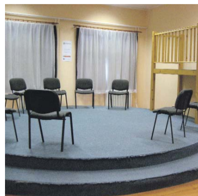
A Moreno terem a népfőiskolán

tak, motivált munkavállalókká váltak, mindent megtettek, hogy javítsák az élethelyzetüket, és az egyház iránt is nyitottak lettek. Mi a magunk részéről a továbbiakban is szívesen foglalkoztunk volna hátrányos helyzetűekkel, így bízunk a további pályázatokban, de 2010-ben másra kaptunk megbízást: egy pályázat keretében a tapasztalatainkat kellett