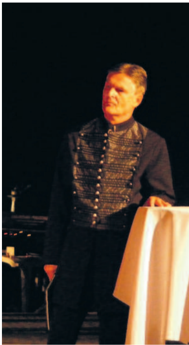
Rubold Ödön (József nádor)

A produkció kellő lendülettel kalauzolja a nézőket a múltba. Mivel egy musical jó dalok nélkül nem működik, nem túlzás azt állítani, hogy Gulyás Levente muzsikája önmagában kellő biztosíték a sikerre. A kó-