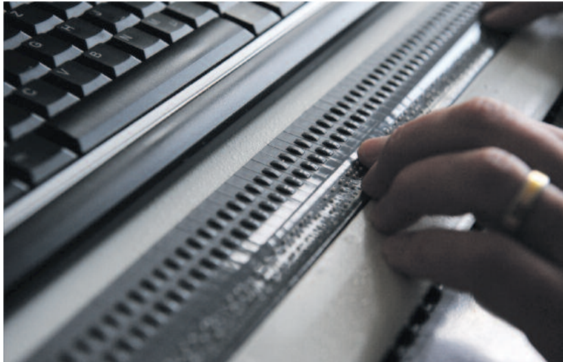
Braille-kijelző használat közben

► Egyre több dolgot intézhetünk on-line: vásárolhatunk, egyetemi, banki vagy egyéb hivatalos ügyeinket intézhetjük, és szinte minden információt megtalálhatunk. Az internet napjaink megkerülhetetlen eszköze, vele a vakoknak is sokkal egyszerűbb és olcsóbb az ügyintézés, a levelezés, kapcsolattartás, mint mondjuk papíron – gondolkunk csak arra, hogy a Braille-írástól a könyvek beszerzése sem könnyű, elég kicsi lévén a választék, és nagy az előállítási költség a hagyományos könyvekhez képest. Sokan viszont el sem tudják képzelni, hogyan lehet a látás képessége nélkül számítógépet használni. Nézzük, hogyan is!