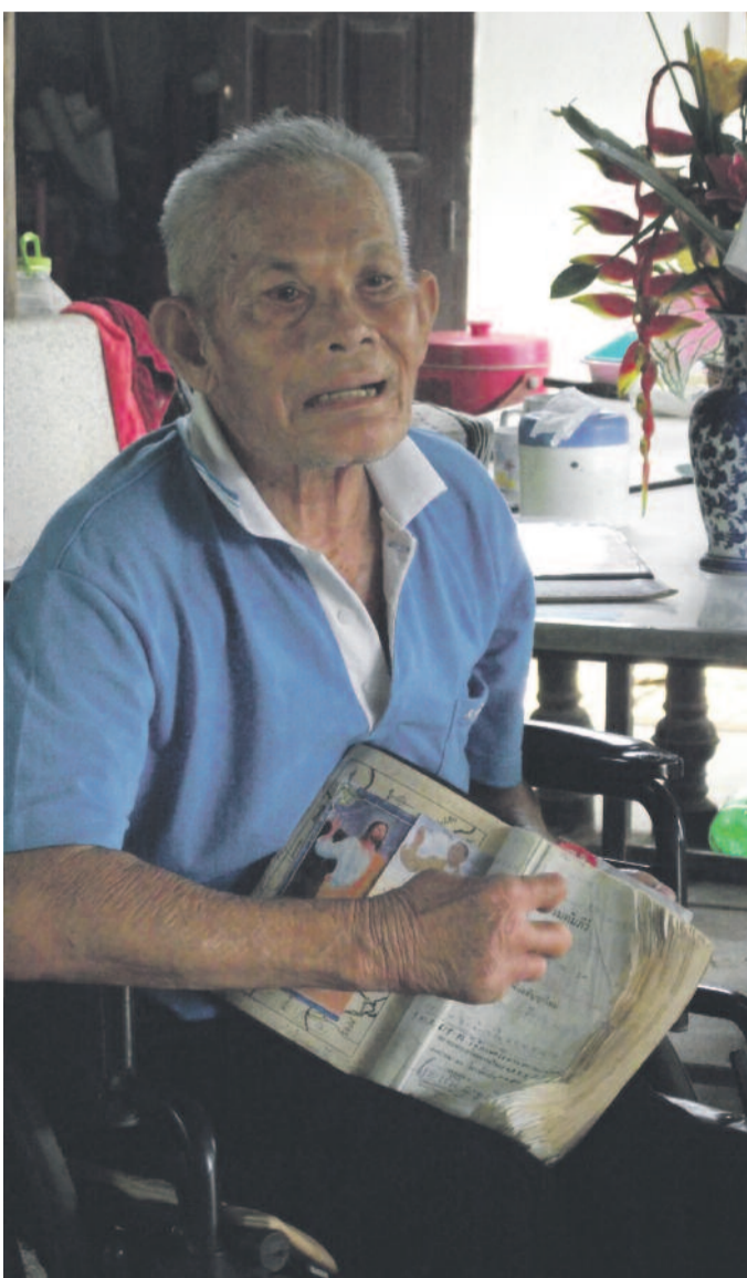
Korábbi leprabeteg Chiang Maiban