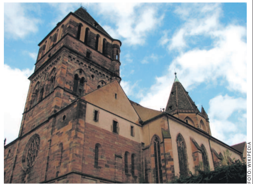
A Szent Tamás-templom

vel kapcsolatban nem a nagy számokon van a hangsúly, hanem a minőség a döntő. Bár sokan az ökumené fagyos korszakáról beszélnek, a katolikus egyházban nyár van.