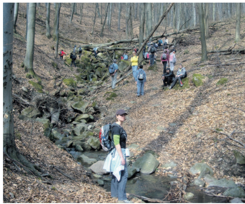
Kirándulás a Pilisben

Ebben az évben – Szociális kompetenciák fejlesztése címmel – a diákszenesnap programjában is helyet kapott a projekt. Nem feledkeztek meg a sportról, a testmozgásról sem: több alkalommal budapesti korcsolyázásra, illetve a Rám-szakadék és a Prédikálós-zék meglátogatására kerítették ismét lehetőséget.