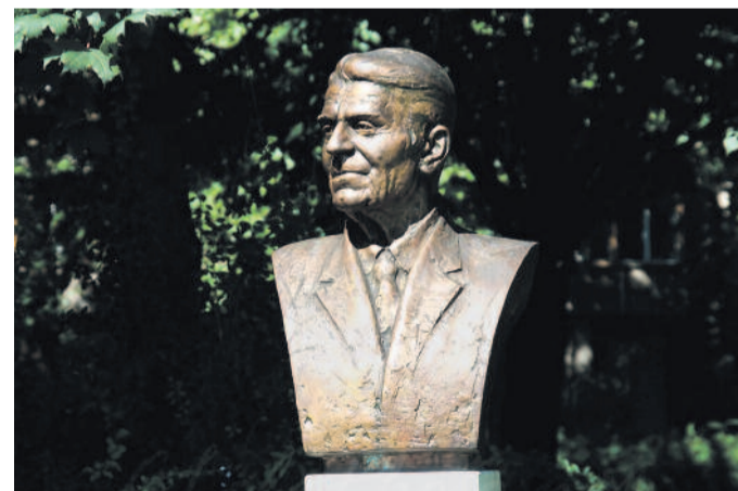
Ronald Reagan elnök mellszobra a városligeti Churchill sétányon

Miről is szolt Ronald Reagan programja? Meghirdette, hogy