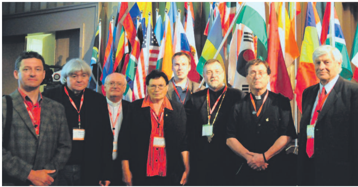
A magyar delegáció