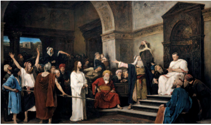
KRISZTUS PILÁTUS ELŐTT