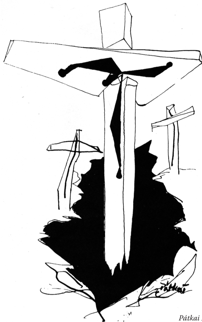
Pátkai Ervin (1937–1985) tusrajza