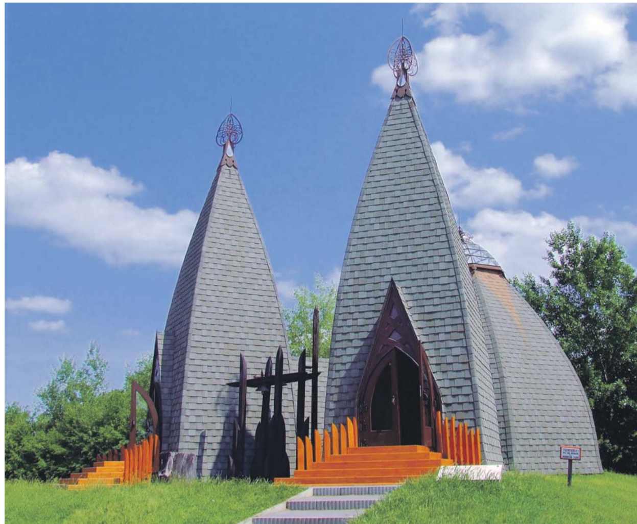
Erdők temploma – Ópusztaszer