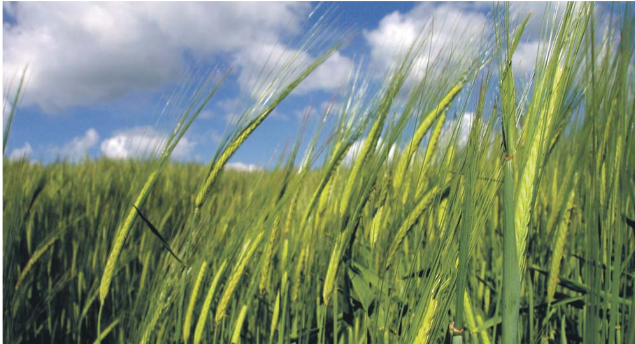
Hatvanad vasárnapjának evangéliuma (Lk 8,4–15) a magvetőről, illetve a négyféle földről szólva Isten igéjének, e drága kegyelmi eszközhöz a sorsát mutatja – a jó földbe hullott magok, amikor felnövekednek, százsoros termést hoznak.