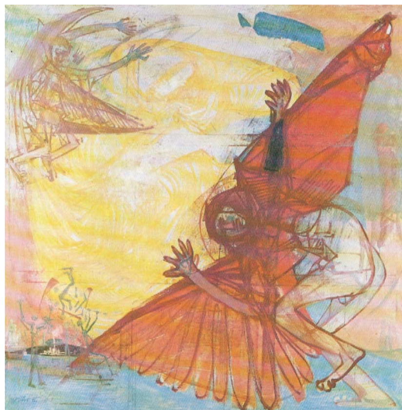
Bukás (Szent Antal megkísértése), 1966

tizedelték meg. Két nagyon művelt és teológiailag felkészült ember vitázott. Olyan közel kerülhetett szellemiségében a lét, a nemlét, a vég-