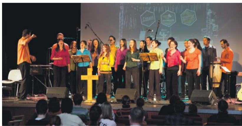
A Pécsi Gospelkórus szolgálata