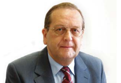
Ittész János püspök Nyugati (Dunántúli) Egyházkerület

Mégis van reménység a szívemben. S tudom, hogy ez reménység nem szegényül meg, mert nem emberek ígéretére épül, nem politikai változásokon tájékozódik. Európai polgárként aggódhatom, számos okom is van rá; de minden keresztény testvéremmel együtt vallom, hogy nekünk kettős állampolgárságunk van, és ez reménységünk végső alapja: „ Nekünk a mennyben van polgárjogunk, ahonnan az Úr Jézus Krisztust is várjuk üdvözítőül... ” (Fil 3,20)