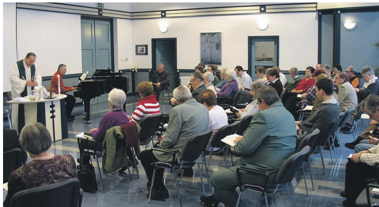
Úrvacsorai záró istentisztelet

kapcsolatos élménye is volt, és amire reformátorra érve is újra meg újra visszaemlékezett: és ez nem más, mint az Isten haragjától és ítéletétől való fenyegetettség állandó érzése, amit a középkori templomok freskói és oltárképei is sugalltak. (...)