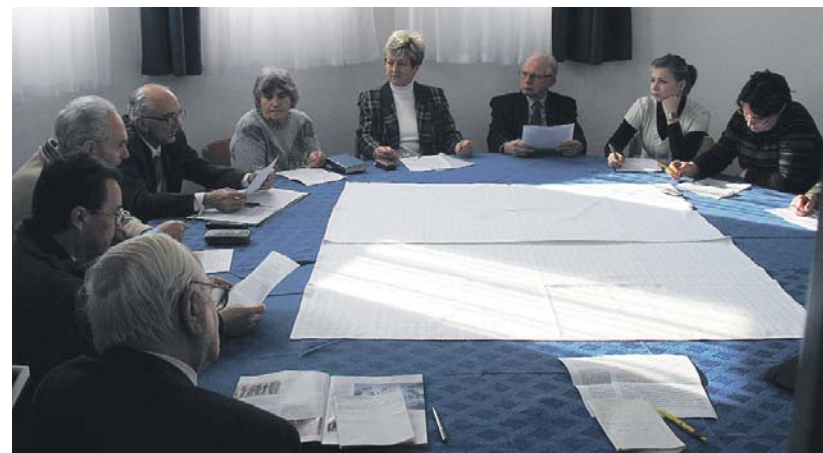
Olvassunk együtt Luthert! – csoportmunka

szűz közül öt nem vitt magával olajat, mert nem hitt abban, hogy megérkezett a pólegény. Ha oly könnyen feladjuk például Krisztus visszajövetelének reményét, mi is elmulasztjuk a nagy alkalmat. Addig kell élni a le-