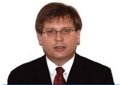
Fabiny Tamás püspök Északi Egyházkerület

A WikiLeaks négy százezer oldalnyi titkos információt hozott nyilvánosságra. Ez a politika és a média területe. Talán mégiscsak különbözik ettől az egyházak világa. A botrányt okozó sok millió mondattal szemben csupán négy szó, a lelkeszi eskü részéeként: „A lelkipásztori titkot megőrzöm.” Titkos szolgálat és titkosszolgálat: ég és föld.