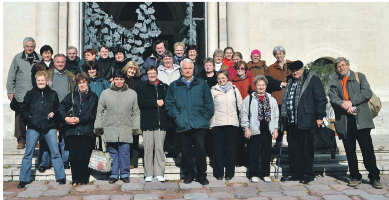
„...az oktatóktól a személyzet tagjaiig”, akik munkájukkal, szeretetükkel a működéshez szükséges hátteret biztosítják