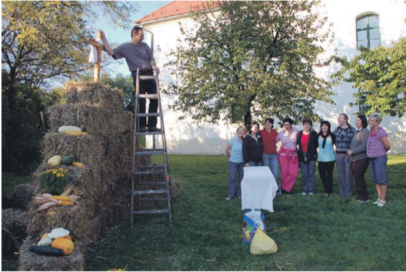
Szalmabálából épített hálaadó oltár