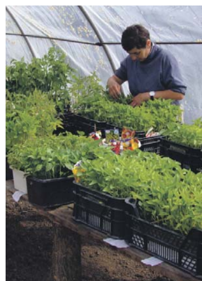
Fólia alatt a szaporító kert

Ami az élelmiszeren túli szükségleteket illeti, azokra is van megoldás. Ismét használni szeretnék az ástott kutakat, amelyeknek a vize jobb mi-