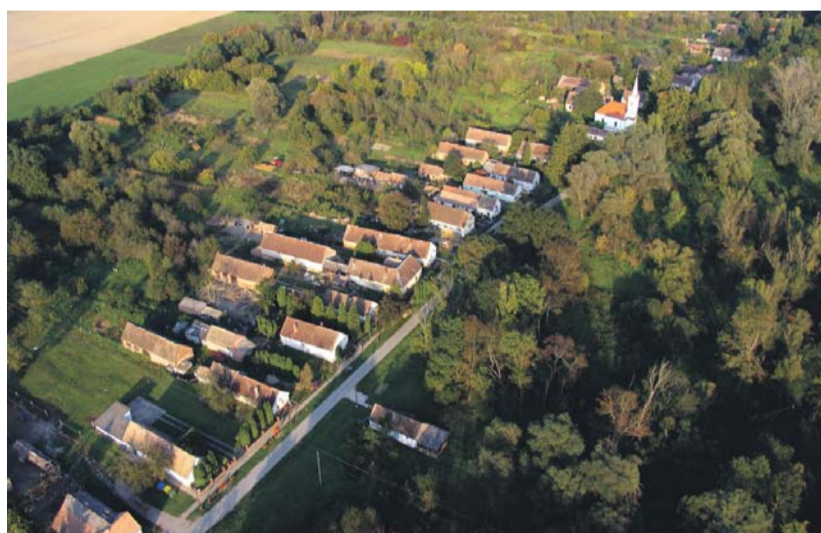
Markóc égi perspektívából

ők nem tervezik meg a saját életüket, akkor megtervezi helyettük más, de abban nem lesz köszönet. Szerencsére a közösség jelentős része ezt meg is értette. Nagyon fontos ez a gondolat. Ezt tartom a vidékfejlesztés alapjának is.