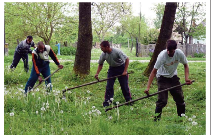
A markóciak nagyot kaszálnak...

Markóc ugyanis nem egy élő kis skanzen, ahol régebbi korok iránti nosztalgizálás folyik, hanem olyan