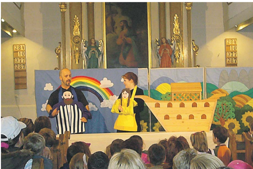
A Nóé bárkája című darab a Habakuk Bábszínház előadásában

képművészeti kiállítás, amely a jubileumi alkalomra készült. Csakúgy, mint a jó hangulatú, meghitt beszélgetésekkel teli nap során, ezen a helyen is szeretnénk köszönetet mondani