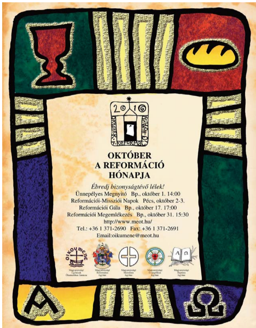
► A reformáció hónapjának regisztrált programjait lásd a 6. oldalon