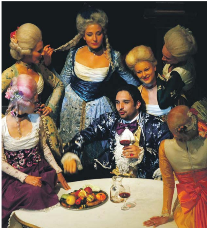
Színpadkép a Prágai Nemzeti Színház miskolci előadásából

szívesen emlékezett vissza e premierre. A bécsi előadás már csalódást okozott, a darab egy időre lekerült a repertoárról. Lorenzo da Ponte emlékirataiban jegyzi le József császár szavait: „Az opera isteni... de nem az én bécsiem fogának való táplálék.”