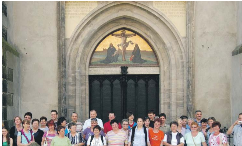
A wittenbergi vártemplom oldalkapujánál

A második napi szállás után utunk Eisleben be vezetett, ahol Luther Márton szülőházát, a városi Szent András-templomot és mellette azt a házat tekintettük meg, ahol reformátorunk 1546-ban meghalt. Erfurt ba