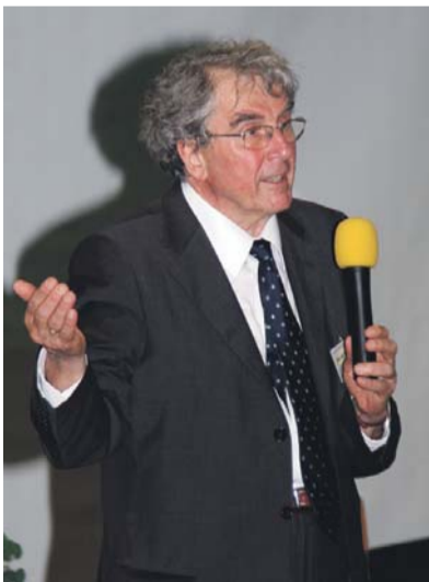
Dr. Réthelyi Miklós

► Magyarország harmincnégy evangélikus oktatási intézményében tizenkétezer gyermek és ifjú tanuló, és mintegy ezer pedagógus dolgozik. Utóbbiak közül több mint kétszázan vettek részt június 28–30. között az evangélikus oktatási rendszer pedagógusainak tizenkilencedik országos találkozásán. A Bonyhádi Petőfi Sándor Evangélikus Gimnáziumban rendezett szakmai konferencia első napján az új kormány egyik – evangélikus kötődéssel is bíró – minisztere, Réthelyi Miklós tisztelte meg a keresztyén tantestületet.