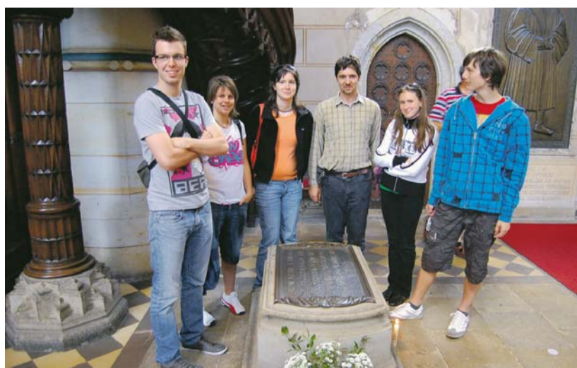
Fiatalok Luther Márton síremléke körül

A második teljes nap a wittenbergi Luther-házban, a volt Ágoston-rendi kolostorban kezdődött. Elsételtünk az egykori egyetem épülete előtt. Betértünk Philipp Melancthon házába. A kastélytemplomban saját templomunk képével díszített gyertyát gyújtottunk reformátoraink sírjánál, és elénekeltünk evangélikus himnuszunkat, az Erős vár a mi Istenünket . Wittenbergi programunk a várostemplomban zárult. Megcsodáltuk, és vezetőnk segítségével kiemeztük a Lucas Cranach által festett „reformációi főoltárt”. Késő délután indultunk tovább Erfurt városába.