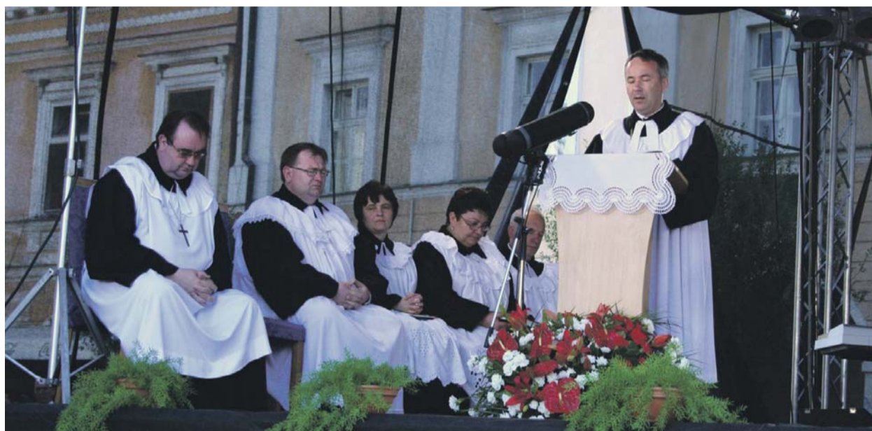
Miloš Klátik elnök-püspök a 113. zsolnai zsinat alapján megfogalmazott igehirdetésében hangsúlyozta: „A zsinat hitvallásossága arra kötelez minket, mai evangélikusokat, hogy mi is mindennap bizonyosságot tegyünk életünkkel az Istennek való szolgálatunkról.”

A Magyarországi Evangélikus Egyházat az ünnepségeken Fabiny Tamás püspök, Pröhle Gergely országos felügyelő, a Külügyminisztérium helyettes államtitkára, Kertész Botond történész és a budapesti szlovák ajkú, valamint a tótkomlói gyülekezet csoportja képviselte.