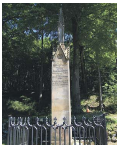
A tisztás, ahol Luthert „elrabolták”

Frigyes választófejedelem által építtetett wittenbergi kastély ifjúsági szállásán eltöltött éjszaka. Volt, aki legszívesebben a vártemplom elkerített oldalbejárata előtt verte volna fel a szállását. Többen is szóba hozták az