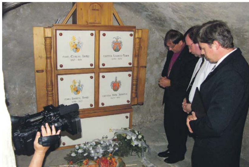
Magyar és szlovák püspök Thurzó György sírjánál az árvi vár kápolnájában

A szombat este a zsolnai főterén bemutatott, a Zákus Média centrum által készített dokumentumfilmben magyarországi szlovákok és szlovákiai magyarok vallanak sorsukról, beszélnek jelenlegi helyzetükről.