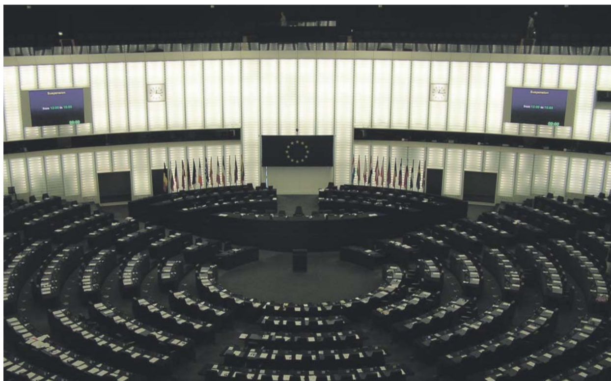
A strasbourgi parlament ülésterme

A szerző a Magyar Televízió Közéleti Szerkesztőségének kiemelt szerkesztője