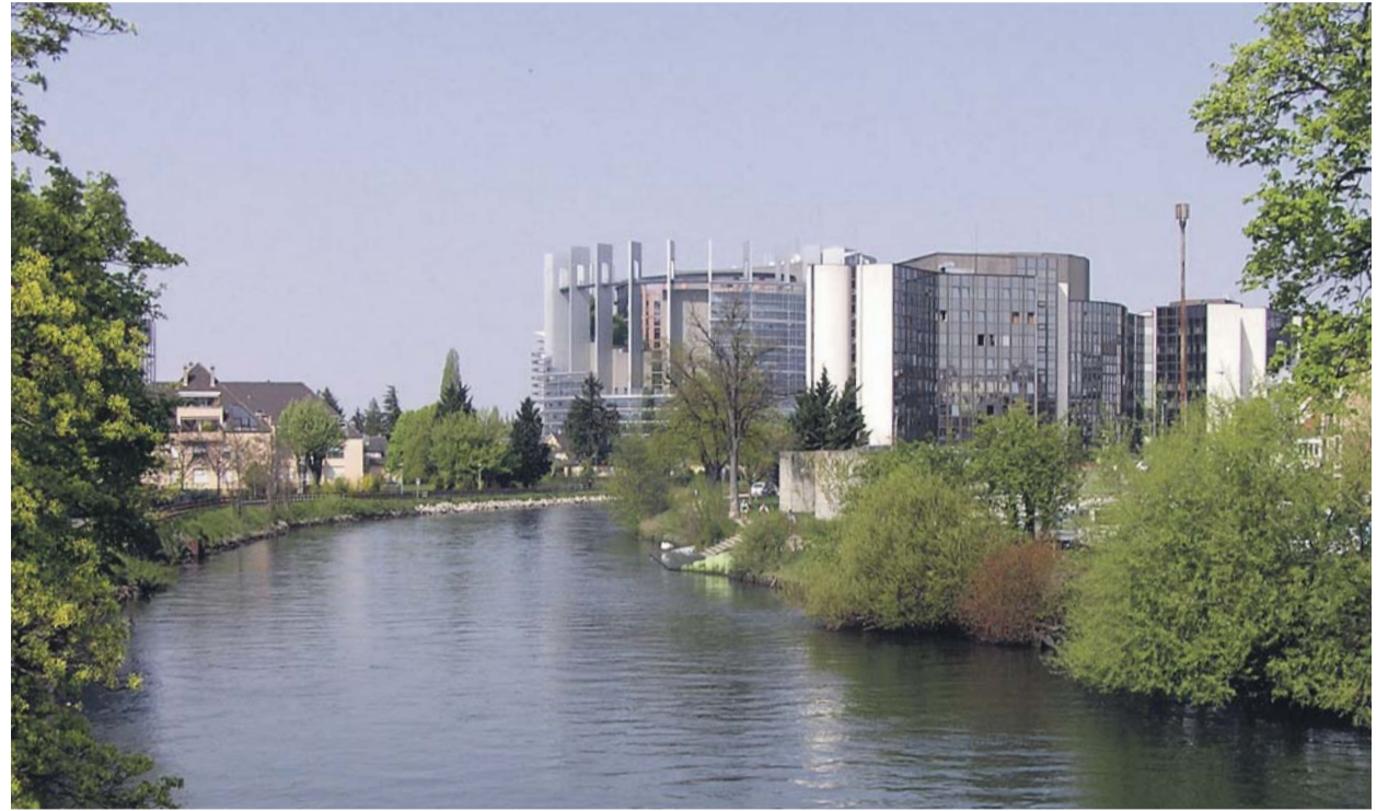
A strasbourgi parlament épülete

Christoph Bergner belügyi államtitkár kinevezésével új korszak kezdődhet a német kisebbségi politikában. Jelenleg ő foglalkozik a határon túl élő német kisebbségek ügyével és