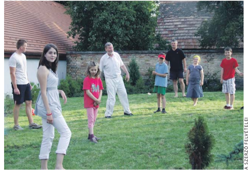
A kert birtokbavétele...