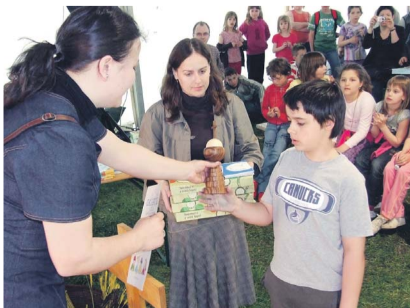
Az olajfából készült vándorkupa útjára indul...