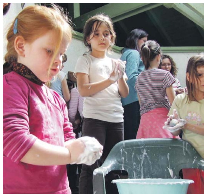
A kisebbek és nagyobbak megismerkedhettek többek között a nemezélés és a kosárfonás rejtelmivel is