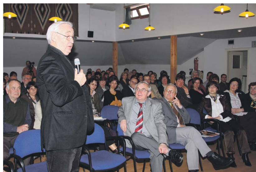
Kivételesnek lenni veszélyes – mondta Czeizel professzor