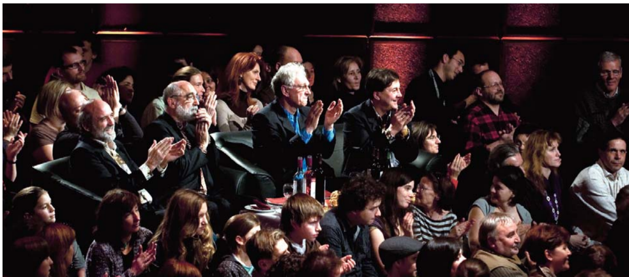
A Kaláka együttes tagjai – ezúttal a nézőtérén...