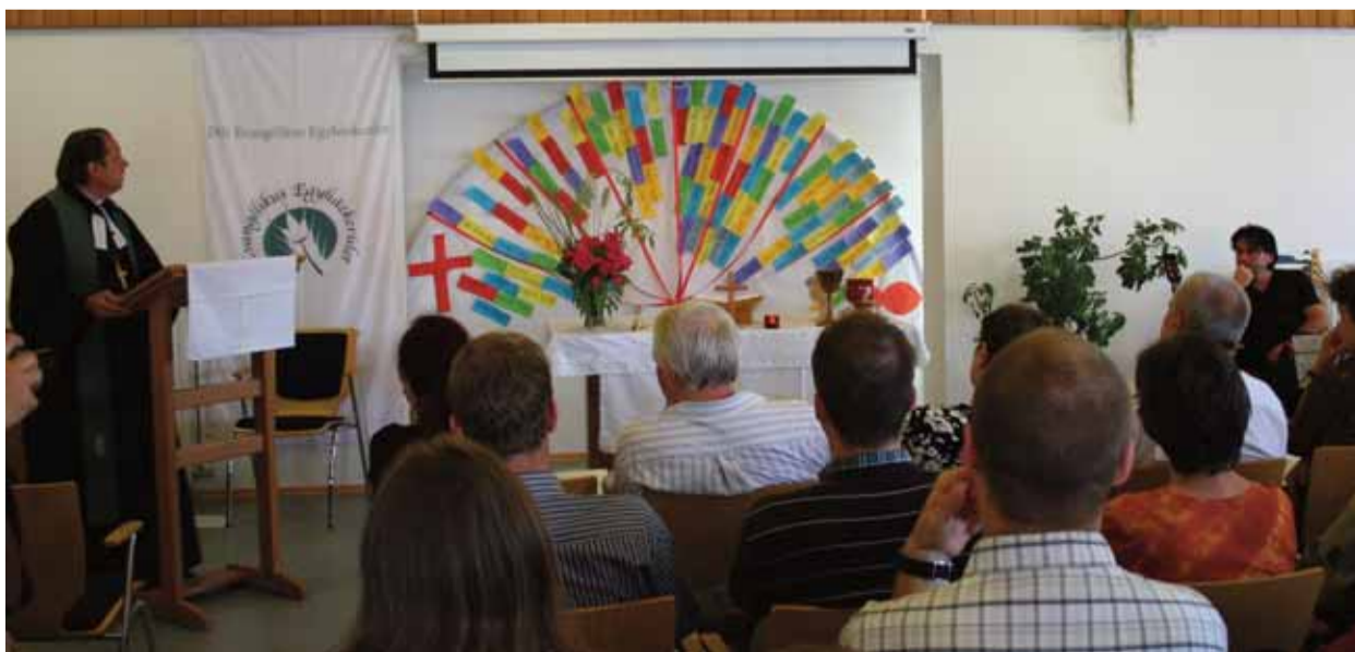
Záró istentisztelet a Déli Egyházkerület munkaévkezdő lelkesítőkonzferenciáján